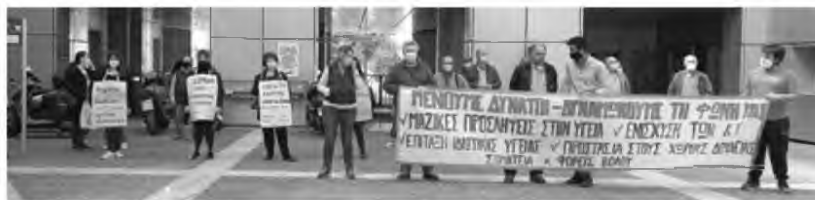
Από την κινητοποίηση που πραγματοποιήθηκε με αφορμή την Παγκόσμια Ημέρα Υγείας στο Αχιλλοπούλειο, με τους συγκεντρωμένους να «μοιράζονται» στο κέντρο και στην αριστερή πλευρά του προαυλίου, ώστε να τηρούν αποστάσεις μεταξύ τους

«Χρειάζεται εδώ και τώρα επίταξη του ιδιωτικού τομέα της Υγείας για να βρεθούν κλίνες, για να βρεθούν ΜΕΘ, για να βρεθεί προσωπικό. Χρειάζεται εδώ και τώρα ένταξη τους στα βαρέα