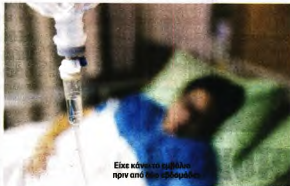
Είχε κάνει το εμβόλιο πριν από δύο εβδομάδες

Ο 60χρονος είχε αρχίσει να νιώθει πόνο στην πλάτη και στα πλευρά, εισήχθη στο ιδιωτικό θεραπευτήριο και εκεί διαγνώστηκε ότι έχει πνευμονική εμβολή. Όπως μετέδωσε το Orpex, κατά τη διάρκεια της νοσηλείας του η υγεία του επιδεινώθηκε, ενώ υπέστη και καρδιακές ανακοπές και γι' αυτό διασωληνώθηκε. Οι γιατροί κατάφεραν να τον επαναφέρουν στη ζωή και ψάχνουν τώρα να δουν κατά πόσο συνδέεται το εμβόλιο της AstraZeneca με την πνευμονική