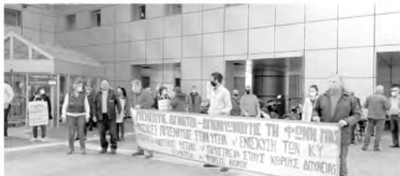
Από την κινητοποίηση στο Νοσοκομείο με αφορμή την παγκόσμια Ημέρα Υγείας

Η παγκόσμια Ημέρα Υγείας «γιορτάστηκε» με κινητοποίηση χθες έξω από το Νοσοκομείο του Βόλου, στην οποία συμμετείχαν εργαζόμενοι και εκπρόσωποι φορέων και συνδικαλιστικών σωματείων, καταγγέλλοντας την κυβέρνηση για απαξίωση του συστήματος Υγείας.