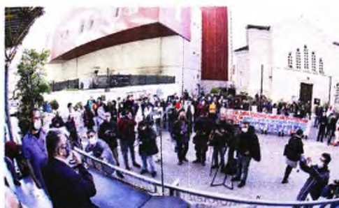
Ο Δ. Κουτσούμπας μιλώντας στη συγκέντρωση

Στην κινητοποίηση συμμετείχαν αντιπροσωπείες του ΠΑΜΕ, της Ομοσπονδίας Βιοτεχνικών Σωματείων Αττικής (ΟΒΣΑ) και της Ομοσπονδίας Γυναικών Ελλάδας, ενώνοτας τη φωνή τους με τους υγειονομικούς, τα αιτήματα και τις διεκδικήσεις τους για επίταξη του ιδιωτικού τομέα Υγείας και μαζικές προσλήψεις μόνιμου προσωπικού. Η κινητοποίηση ολοκληρώθηκε με πορεία μέχρι την οδό Βασιλίσσης Σοφίας, με το Σωματείο να διεκδικεί «Προσλήψεις, αυξήσεις, ανθυγιεινό, δωρεάν Υγεία για όλο το λαό».