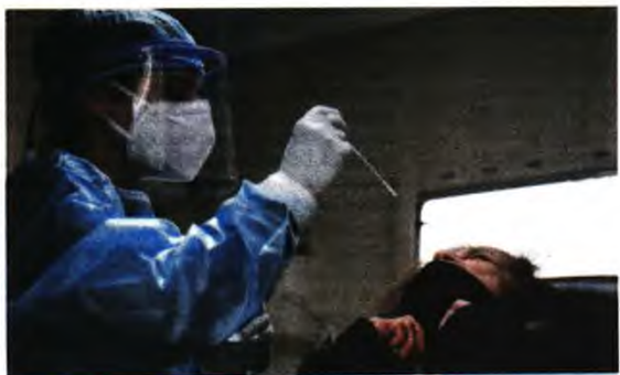
Σε επίπεδο συναγερμού η κατάσταση της πανδημίας

Τέλος, διενεργήθηκαν συνολικά 55.179 τεστ, εκ των οποίων 20.419 μοριακά και 34.760 rapid. Η θετικότητα ανέρχεται σε 6,24%. Την εβδομάδα 29 Μαρτίου-04 Απριλίου (Iso Week 13) το ποσοστό θετικότητας ήταν 6,37% σε σύνολο 113.766 RT-PCR και 220.256 Rapid Ag τεστ που πραγματοποιήθηκαν.