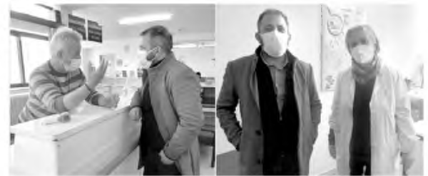
Το κέντρο υγείας Βελεστίνου επισκέφθηκε ο Βουλευτής Μαγνησίας του ΣΥ.ΡΙΖ.Α.- Προοδευτική Συμμαχία Αλέξανδρος Μείκopoulos

«Σε αυτή τη δύσκολη στιγμή του τρίτου κύματος της πανδημίας συνειδητοποιούμε όλοι ότι η υγεία είναι πράγματι το πολυτιμότερο αγαθό για την ανθρώπινη ζωή. Χρέος όλων μας είναι να επενδύσουμε στη Δημόσια Υγεία, καθώς και να ευχαριστήσουμε ακόμα μια φορά όλους τους εργαζόμενους που υπηρετούν το σύστημα υγείας, ευρισκόμενοι παράλληλα και στην πρώτη γραμμή του αγώνα κατά του Covid-19, παρέχοντας υψηλής ποιότητας περίθαλψη και φροντίδα, με αυτοθυσία και αφηρητότητα τον κίνδυνο για τη δική τους υγεία. Ας μην ξεχνάμε όμως, ότι η κρίση αυτή θα περάσει...! Ο επαγγελματίας