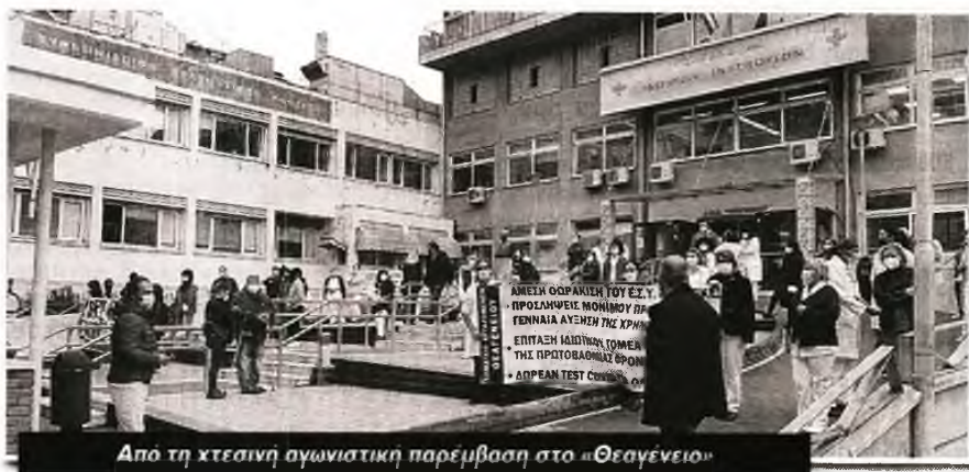
Από τη χτεσινή αγωνιαστική παρέμβαση στο «Θεαγένειο»

Στο «Ιπποκράτειο» νοσηλεύονται 120 ασθενείς και η ΜΕΘ είναι σχεδόν γεμάτη. Η διοίκηση μετακινεί γιατρούς και νοσηλευτές για να στελεχώσει το μπλε κτίριο, όπου στεγάζει τις κλινικές κορονοϊού. Στο πλαίσιο αυτό ενισχύθηκε και πάλι με 10 επικουρικούς νοσηλευτές από το «Θεαγένειο», που επίσης στενάζει από την