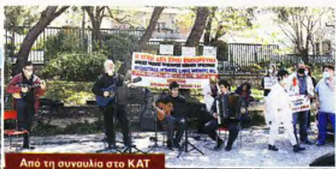
Από τη συναυλία στο ΚΑΤ

Συμβολική παράσταση διαμαρτυρίας πραγματοποιήθηκε στο «Κέντρο Βρεφών Μητέρας» με τη συμμετοχή εργαζομένων του ιδρύματος, σωματείων και μαζικών φορέων της περιοχής, απαιτώντας να μην απολυθεί κανείς από τους επικουρικούς στην Πρόνοια, οι οποίοι πήραν παράταση μέχρι την δημοσίευση του διορισμού των επιτυχόντων των οριστικών πινάκων.