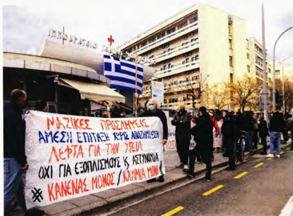
MOTION TEAM / ΒΕΡΒΕΡΙΔΗΣ ΒΑΣΙΛΗΣ

Σύμφωνα με την κ. Κατσίμπα, τα νοσοκομεία αντιμετωπίζουν μόνο τα επείγοντα περιστατικά κοινής νοσηλείας, αφού ήδη «κάθε νοσοκομείο που πρόκειται να εφημερεύσει –στα περισσότερα