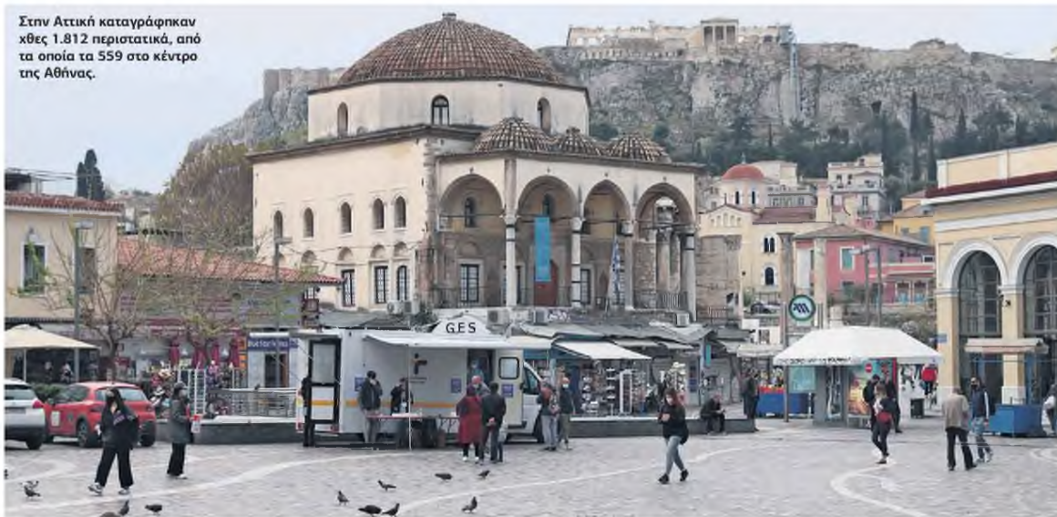
Στην Αττική καταγράφηκαν χθες 1.812 περιστατικά, από τα οποία τα 559 στο κέντρο της Αθήνας.

ΡΕΚΟΡ ΔΙΑΣΩΛΗΝΩΜΕΝΩΝ, ΘΑΝΑΤΩΝ • ΠΩΣ ΚΑΤΑΓΡΑΦΕΤΑΙ Η ΚΑΤΑΣΤΑΣΗ ΣΤΑ ΝΟΣΟΚΟΜΕΙΑ