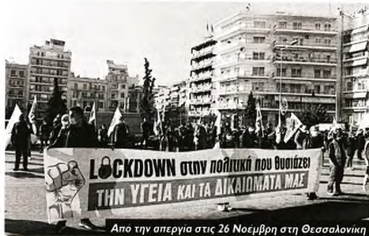
Από την απεργία στις 26 Νοεμβρίου στη Θεσσαλονίκη

Στην πείρα από τους αγώνες ενάντια στους σχεδιασμούς της κυβέρνησης στη Δευτεροβάθμια και Τριτοβάθμια Εκπαίδευση με τον νόμο Κεραμέως - Χρυσοχοϊδη, αλλά και για την ασφαλή διά ζώσης επαναλειτουργία σχολείων και πανεπιστημίων, αναφέρθηκαν εκπρόσωποι των εργαζομένων στο ΑΠΘ, εκπαιδευτικοί. Τον λόγο πήραν και εκ-