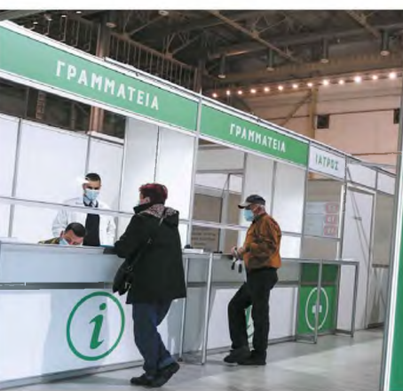
Η συμμετοχή των πολιτών στο εμβολιαστικό πρόγραμμα κινείται στο ίδιο επίπεδο του ευρωπαϊκού μέσου όρου, που είναι 60%.