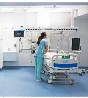
Η κάλυψη των κλινών ΜΕΘ COVID στην επικράτεια είναι στο 85% και των απλών κλινών στο 59%. Χθες ανακοινώθηκαν 4.033 νέοι κρούσματα της COVID-19 και 93 θάνατοι.

Πάντως, τάση μείωσης του ιικού φορτίου στην Αττική –μετά ένα πολύ μεγάλο διάστημα κατά το οποίο αυτό ήταν σταθερά υψηλό– καταδεικνύει η ανάλυση των λυμάτων του λεκανοπεδίου. Σύμφωνα με τα τελευταία δεδομένα των εργαστηριακών ελέγχων του Εθνικού δικτύου Επιδημιολογίας Λυμάτων, την προηγούμενη εβδομάδα παρατηρήθηκε μείωση της τάξης του 33% στο ιικό φορτίο των λυμάτων, σε σχέση με μία εβδομάδα πριν. Μείωση παρατηρήθηκε και στα αστικά λύματα του Αγίου Νικολάου Κρήτης. Στην αντίθεση, σημαντική αύξηση του ιικού φορτίου εντοπίστηκε στην Σάχη (αύξηση κατά 196%), στο Ηράκλειο Κρήτης (+122%), στο Ρέθυμνο (+74%) και στα Χανιά (+50%). Οριακές θεωρούνται οι αυξήσεις στην Αλεξανδρούπολη (+20%) και στη Λάρισα (+21%), αφού σύμφωνα με τους ερευνητές οι μεταβολές αυτού του μεγέθους εμπίπτουν στα όρια της εργαστηριακής αβεβαιότητας, ενώ σταθερό παραμένει το ιικό φορτίο στην Πάτρα, στη Θεσσαλονίκη και στον Βόλο.