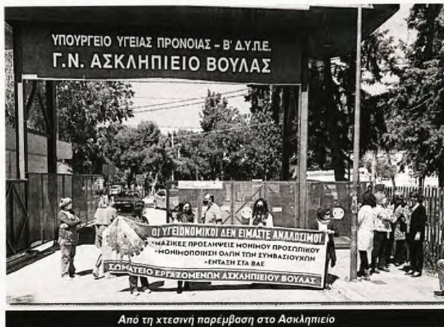
Από τη χτεσινή παρέμβαση στο Ασκληπείο

Από τη μεριά της, η διοίκηση του νοσοκομείου κάνει την ανήχηρη για το «μέτρο ενόχλησης» και παράλληλα «μας ζητάει να κάνουμε υπομονή και να το (...) δοκιμάσουμε, ενώ προσπαθεί να μας πείσει με αστήρικτα επιχειρήματα που