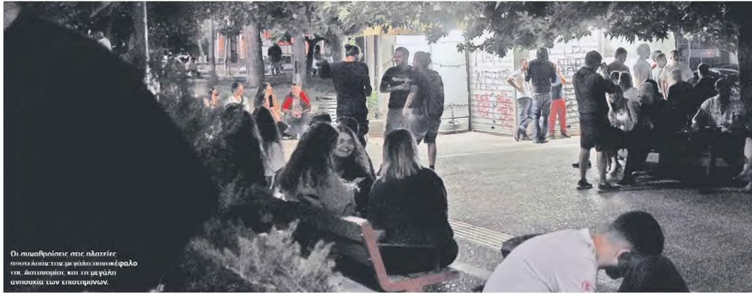
Οι συναθροίσεις στις πλατείες όπως αυτή του μεγάλου ανοικτού κεφαλά στην Αποστολεία και τη μεγάλη ανοικτότητα των επιστημονών.

Στο μεταξύ, τα στελέχη της ΕΛ.ΑΣ. επεξεργάζονται σχέδια αποτελεσματικής αντιμετώπισης των ανεξέλεγκτων διοργανώσεων διασκέδασης από τη μία, με ήπια διαχείρισή τους, από την άλλη. Το «μοντέλο» της πλατείας Βαρνάβα μπορεί θεωρητικά να πέτυχε,