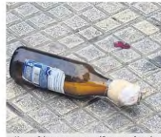
Και μολότοφ στα σκουπίδια της πλατείας Αγίου Γεωργίου...