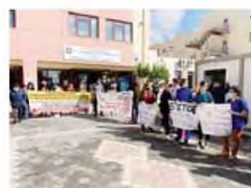
Από παλαιότερη κινητοποίηση στην 7η Υ.Π.Ε.