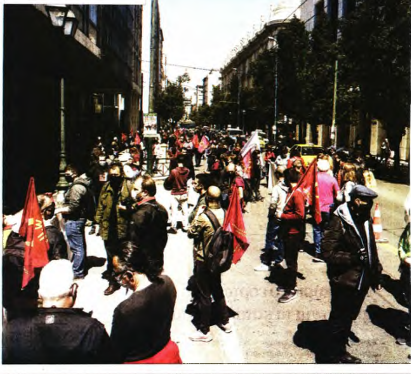
Στιγμιότυπα από τη χθεσινή πορεία διαμαρτυρίας των εργαζομένων σε τουρισμό και επισιτισμό στην πλατεία Κλαυθμύων και στο υπουργείο Εργασίας

Με βάση και την πρόοδο του εμβολιαστικού προγράμματος, η ανοσία της κοινότητας έναντι του κορονοϊού προβλέπεται -κατά τον καθηγητή του ΑΠΘ- στα τέλη Οκτωβρίου.