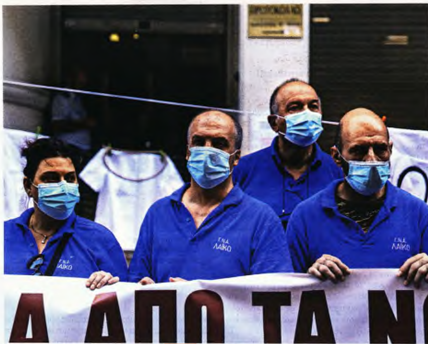
Έντονες διαφωνίες για την τροπολογία εξέφρασε η ΠΟΕΔΗΝ, ενώ και η ΕΙΝΑΠ ζήτησε την απόσυρσή της

Με τροπολογία-πρόκληση για τους συγγενείς των χιλιάδων θυμάτων της Covid-19 η κυβέρνηση απαλλάσσει από κάθε ευθύνη τα μέλη τριών επιτροπών ● Δεν διώκονται, δεν λογοδοτούν, δεν εξετάζονται σε ενδεχόμενη ποινική διερεύνηση ● Ασπίδα προστασίας και για κυβερνητικά στελέχη, ενώ άφησαν εκτεθειμένο σε μηνύσεις το ιατρονοσηλευτικό προσωπικό