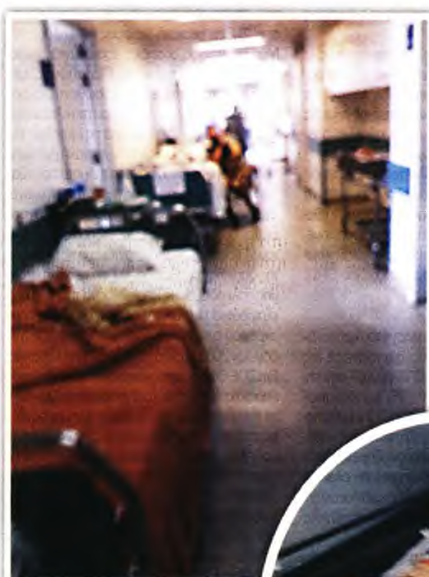
Ίδιες εικόνες με αμέτρητα ράντσα στα νοσοκομεία της Αττικής

» Τριτοκοσμικές εικόνες στα νοσοκομεία της Αττικής! Αμέτρητα ράντσα έχουν γεμίσει τους διαδρόμους, κυρίως για γενικά παθολογικά περιστατικά!