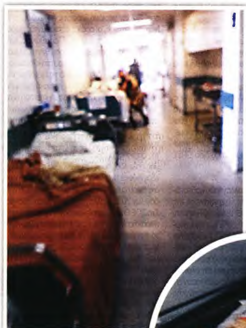
Ίδιες εικόνες με αμέτρητα ράντσα στα νοσοκομεία της Αττικής

» Τριτοκοσμικές εικόνες στα νοσοκομεία της Αττικής! Αμέτρητα ράντσα έχουν γεμίσει τους διαδρόμους, κυρίως για γενικά παθολογικά περιστατικά!