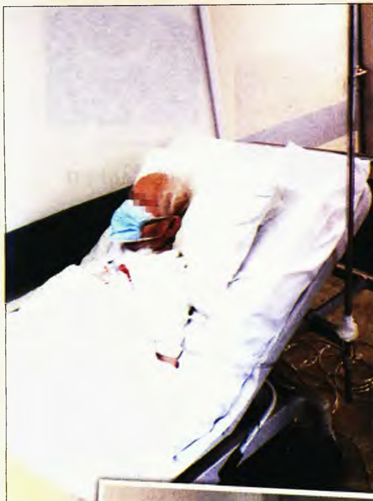
Διάδρομοι γεμάτοι ράντσα και ασθενείς, οι οποίοι νοσηλεύονται με γενικά παθολογικά περιστατικά