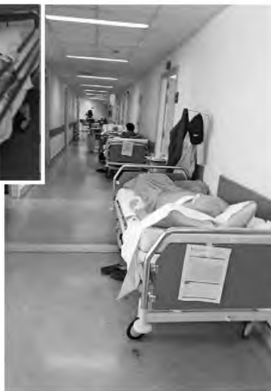
Εικόνες ντροπής: Ασθενείς σαν σακά στους διαδρόμους