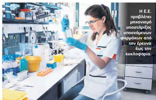
Η Ε.Ε. προβλέπει μηχανισμό υποστήριξης υποσχόμενων φαρμάκων από την έρευνα έως την κυκλοφορία.