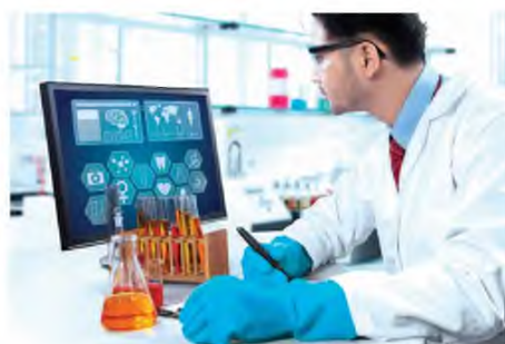
Το πρόγραμμα HelloAIRIS θα πραγματοποιηθεί φέτος από τις 21 Ιουνίου έως τις 30 Αυγούστου διαδικτυακά, με την προθεσμία για την υποβολή αιτήσεων συμμετοχής να εκπνέει στις 28 Μαΐου.