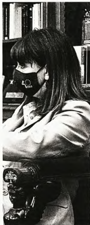
ΕΥΡΩΚΙΝΗΣΗ / ΠΑΝΑΝΑ ΜΠΟΥΔΟΥ

*Ενα από τα παραπάνω. Οι ανωτέρω υποχρεώσεις συμπεριλαμβάνουν και παιδιά από έξι ετών και άνω.