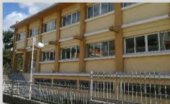
νοδοσκόου εμβολίου της J&J που θα χορηγείται και πάλι σε λίγες ημέρες και στα Ιωάννινα.

Επίσης, η 6η ΥΠΕ είναι εκείνη που θα πρέπει να ξεκαθαρίσει σύντομα το πλαίσιο και τον αριθμό των εμβολιαστικών γραμμών στα Ιωάννινα και εάν στις 21 υπάρχουσες θα προστεθούν και νέες στο κτίριο του ΠΕΔΥ ή εάν σε αυτό – που είναι και το πιθανότερο – θα μεταφερθούν κάποιες από τις υφιστάμενες γραμμές των δύο νοσοκομείων και του Κέντρου Υγείας Ιωαννίνων. Επίσης, ενδέχεται να χρησιμοποιηθεί και ως εμβολιαστικό κέντρο αποκλειστικά για τη χορήγηση του μο-