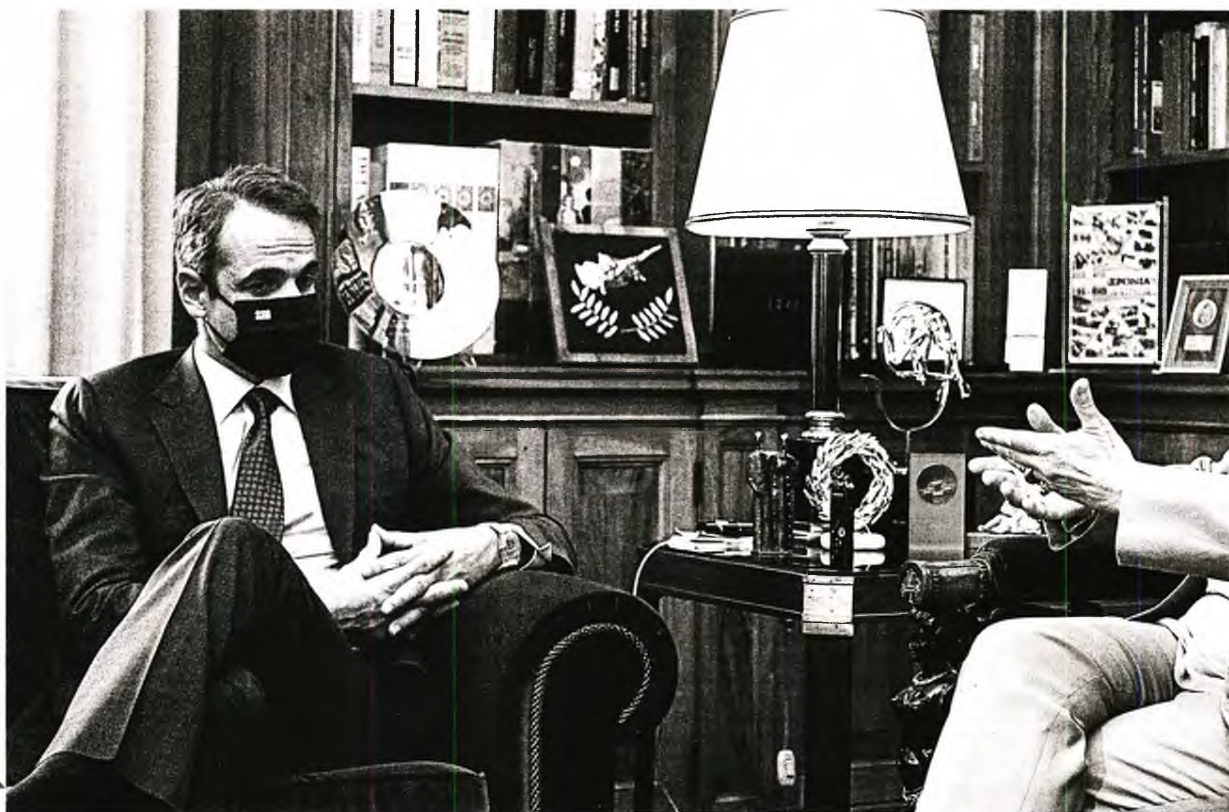
Στη συνάντησή του στο Προεδρικό Μέγαρο με την Κατερίνα Σακελλαροπούλου, ο Κυριάκος Μητσοτάκης αγείδει τον ταχύ βηματισμό τόσο προς την υποχρεωτικότητα των εμβολιασμών όσο και προς τα προνόμια για τους εμβολιασμένους

Στην κυβέρνηση προσπαθούν με νέες εκκλήσεις προς τους πολίτες για «εμβολιαστικό κύμα» εντός του καλοκαιριού