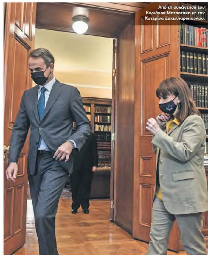
Από τη συνάντηση του Κυριάκου Μητσοτάκη με την Κατερίνα Σακελλαροπούλου.

Ο πρωθυπουργός επέλεξε να παρέμβει χθες στη Βουλή για να υπογραμμίσει και προσωπικά τη σημασία του ευρωπαϊκού πιστοποιητικού ως μία τολμηρή ελληνική πρωτοβουλία, καθώς πρώτη η χώρα μας το εισήχθη στους ευρωπαϊκούς θεσμούς, ενώ επισήμανε ότι συνιστά ταυτόχρονα και απόδειξη ότι «ακόμα και στο πιο σκοτεινό σημείο του τρίτου κύματος, τον Ιανουάριο αυτού του έτους, η χώρα είχε σχέδιο και προνοητικότητα». Υπενθύμισε μάλιστα ότι η Ελλάδα βρέθηκε στην πρώτη γραμμή και άλλων πρωτοβουλιών, καθώς ήταν από