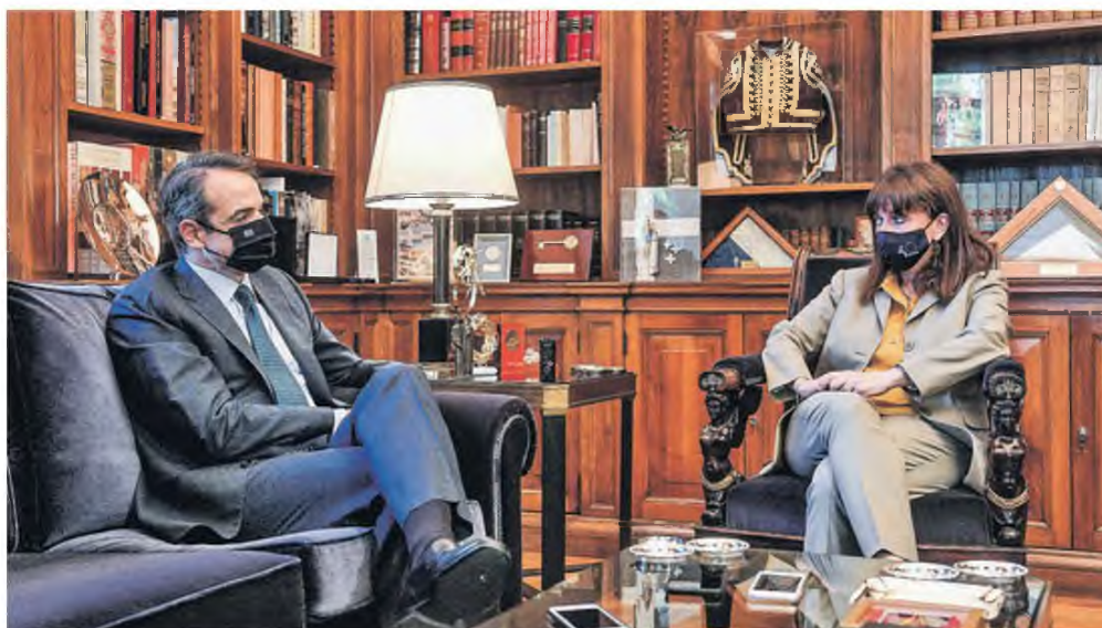
«Το σύνταγμα κατά κανέναν τρόπο δεν αναγνωρίζει δικαίωμα σε κάποιον να θέτει σε κίνδυνο τη ζωή του άλλου» σχολίασε στη συνάντησή της με τον πρωθυπουργό η Πρόεδρος της Δημοκρατίας ενόψει του υποχρεωτικού εμβολιασμού των υγειονομικών