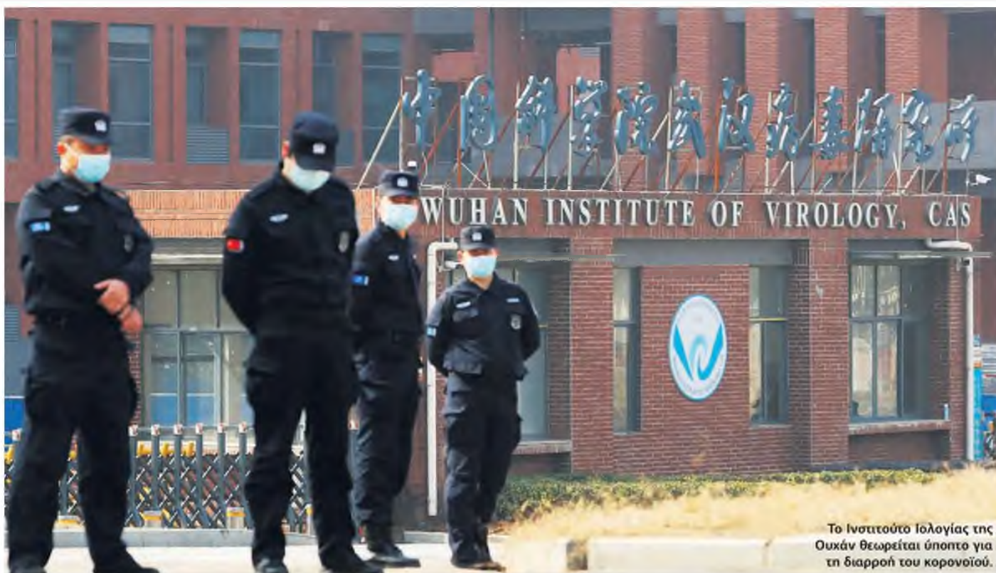
Το Ινστιτούτο Ιολογίας της Ουχάν θεωρείται ύποπτο για τη διαρροή του κορονοϊού.

ΣΤΟ ΦΩΣ ΑΠΟ ΤΗ «WALL STREET JOURNAL» ΕΚΘΕΣΗ ΑΜΕΡΙΚΑΝΩΝ ΕΠΙΣΤΗΜΟΝΩΝ