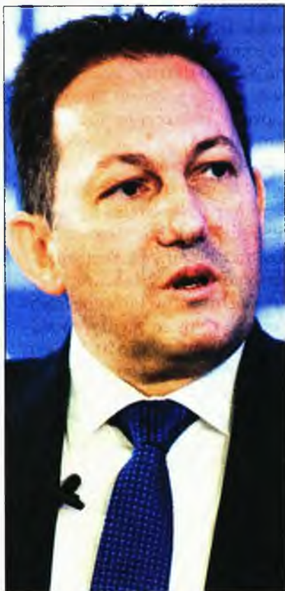
Ο Στέλιος Πέτσας

Το Μαξίμου έβαλε τον υπουργό της λίστας να απειλεί εργαζομένους του δημόσιου και του ιδιωτικού τομέα