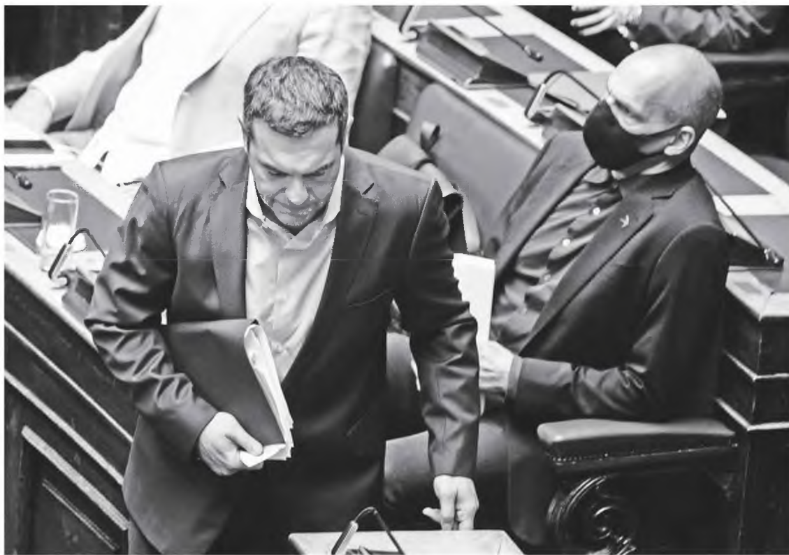
Αλ. Τσίπρας και Γ. Βαρουφάκης δεν προτρέπουν ξεκάθαρα τον κόσμο να εμβολιαστεί, όπως κάνει ο Δ. Κουτσούμπας και η Φώφη Γεννηματά.

Αν ήθελαν να ασκήσουν πειστική και σκληρή κριτική κατά της κυβέρνησης θα αναδείκνυαν τα κακώς κείμενα, θα έπαιρναν θέση κατά της επιβολής κ.λπ., αλλά ταυτόχρονα και