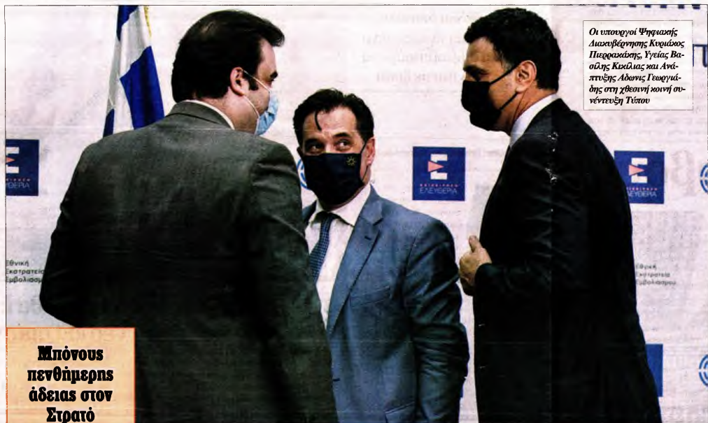
Οι υπουργοί Ψηφιακής Διακυβέρνησης Κιwiώσης Πιστοποίησης, Υγείας Βασίλης Κιwiώσης και Ανάπτυξης Αδωνης Γεωργιάδης στη χθεσινή κοινή συνέντευξη Τύπου

■ Δομές υγείας. Εξίσου υποχρεωτικός γίνεται στο εξής ο εμβολιασμός σε όλες τις δημόσιες και ιδιωτικές δομές υγείας, όπως είναι τα διαγνωστικά κέντρα, οι κλινικές και τα νοσοκομεία. Οι εργαζόμενοι σε αυτά θα πρέπει να έχουν κάνει την πρώτη δόση έως την 1η Σε-