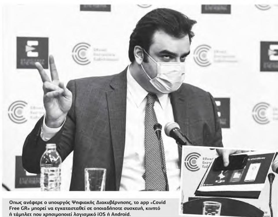
Όπως ανέφερε ο υπουργός Ψηφιακής Διακυβέρνησης, το app «Covid Free GR» μπορεί να εγκατασταθεί σε οποιαδήποτε συσκευή, κινητό ή τάμπλετ που χρησιμοποιεί λογισμικό iOS ή Android.

ΕΦΑΡΜΟΓΗ: ΤΑ 3 ΕΠΙΠΕΔΑ ΣΤΗΝ ΕΠΑΛΗΘΕΥΣΗ ΤΟΥ ΠΙΣΤΟΠΟΙΗΤΙΚΟΥ