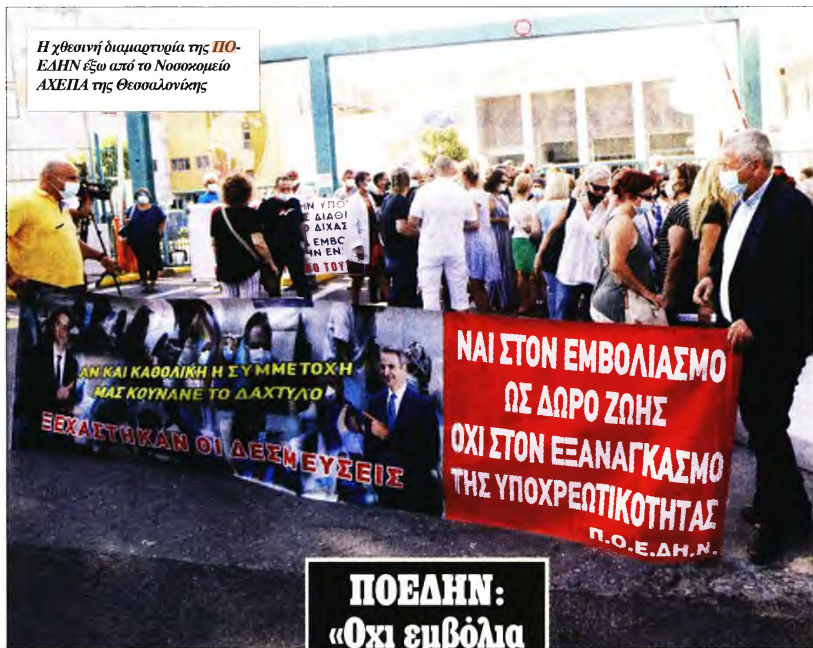
Η χθεσινή διαμαρτυρία της ΠΟΕΔΗΝ έξω από το Νοσοκομείο ΑΧΕΠΑ της Θεσσαλονίκης

«Ξέραμε ότι στο προηγούμενο κύμα χρειαζόταν να μπου στο νοσοκομείο οι πέντε, οι έξι, οι επτά από τους 100. Τώρα είναι αρκετοί εμβολιασμένοι και πολλά παιδιά, άρα πιθανότητα να είναι ένας δυο στους 100 που θα χρειαστούν νοσηλεία, δηλαδή στους 200 θα χρειαστεί να νοσηλευτούν δυο τρία άτομα. Λοιπόν, φτιάχνεις τις δομές, προετοιμάζεις το Κέντρο Υγείας για να μπορεί να υποδεχτεί περιστατικά, κάνεις δομή καραντίνας, αν χρειαστεί, φροντίζεις να υπάρχει ελκτικό περικό για να πάρει τον έναν την εβδομάδα ή το δεκάημερο που θα χρειαστεί να πάει σε ένα κεντρικό νοσοκομείο και αφήνεις τη ζωή» ανέλυσε με νόημα.