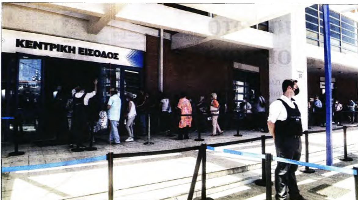
Ο Κυριάκος Μητσοτάκης παρακαλούσε τους εξοπλιστικούς να σπεύσουν να εμβολιαστούν, αν και η κυβέρνηση βρίσκεται ένα βήμα πριν από τον υποχρεωτικό εμβολιασμό τους

Η ρύθμιση κατατέθηκε στην επίμαχη τροπολογία για τον υποχρεωτικό εμβολιασμό υγειονομικών και φροντιστών ηλικιωμένων και αναπήρων, που προκάλεσε την οξύτερη αντίδραση της αντιπολίτευσης, η οποία καταγγέλλει πως