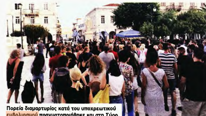
Πορεία διαμαρτυρίας κατά του υποχρεωτικού εμβολιασμού πραγματοποιήθηκε και στη Σύρο.