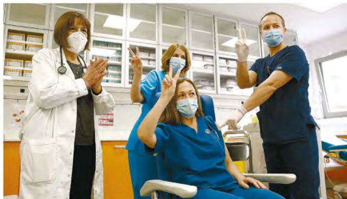
Η διάθεση των εμβολίων εύλογα έχει δημιουργήσει ένα κλίμα αισιοδοξίας για την υπέρβαση της πανδημίας.

Όσο, μάλιστα, ο εμβολιασμός προχωράει και ενισχύεται η εντύπωση ότι είμαστε «κοντά στον στόχο», τόσο ενισχύεται η αντίληψη ότι