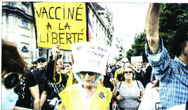
Στη γαλλική πρωτεύουσα από μαζική διαδήλωση στο Παρίσι κατά του διαχωρισμού των πολιτών μέσω της υποχρεωτικής «κάρτας υγείας»

«Ο Μακρόν, με την υποχρεωτική «κάρτα υγείας», επιβάλλει στον επισκέπτη, τον φύλακα, τον έμπορο να επαληθεύουν την ταυτότητα των χρηστών ή των πελατών τους σε παράβαση του νόμου, της νομολογίας και του ιατρικού απορρήτου» λέει ο καθηγητής στο Τμήμα Μεταπτυχιακών Σπουδών στο Πανεπιστήμιο της Γενεύης Ζαν Φρανσουά Μπαγιάρ και συνεχίζει: «Αυτός ο άνθρωπος, ο Εμανουέλ Μακρόν, είναι σίγουρα επικίνδυνος, γιατί επιβάλλει σε όλους το βάρος της εφαρμογής και της επαλήθευσης του μέτρου που σκοτώνει την ελευθερία. Ένα ετερόκλητο πλή-