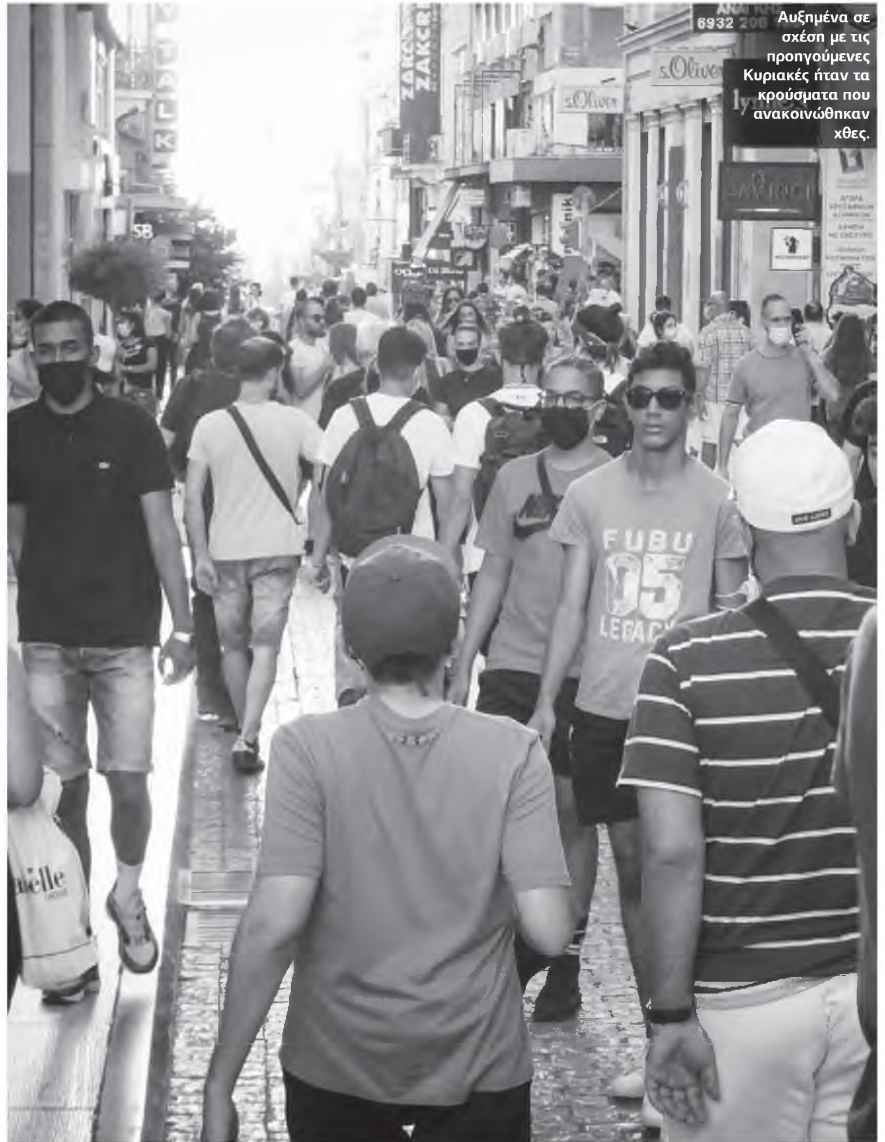
6932 208 Αυξημένα σε σχέση με τις προηγούμενες Κυριακές ήταν τα κρούσματα που ανακοινώθηκαν χθες.

► Αύξηση ψυχοδραστικών ουσιών κατά 20% κατεγράφη από την επεξεργασία των λυμάτων κατά το πρώτο lockdown και ιδίως τις πρώτες εβδομάδες, με την αύξηση αυτή