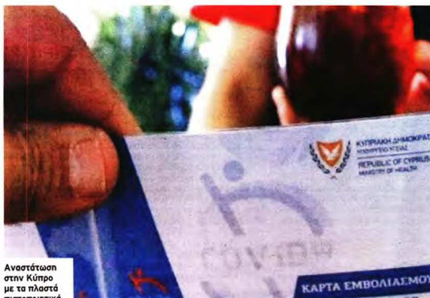
Αναστάτωση στην Κύπρο με τα πλαστά πιστοποιητικά.

στη Λεμεσό και ο ένας στην Πάφο. Παρά το ότι οι καταγγελίες βρίσκονται στα χέρια της αστυνομίας εδώ και ένα μήνα, φαίνεται πως η διερεύνησή τους θα αρχίσει σήμερα υπό την πίεση που ασκείται λόγω της αποκάλυψης του σκανδάλου. Στο μεταξύ ο Παγκύπριος Ιατρικός Σύλλογος εξετάζει καταγγελίες που βρίσκονται ενόπιόν του και θέλουν γιατρούς ή επαγγελματίες Υγείας να παρακινούν πολίτες να μην εμβολιαστούν προβάλλοντάς τους ψευδή δεδομένα για τον εμβολιασμό. Η ύπαρξη αντιεμβολιστών γιατρών που παρακινούν πολίτες να μην εμβολιαστούν, με αποτέλεσμα κάποιοι εξ αυτών να καταλήγουν στα νοσοκομεία, απασχολεί έντονα το υπουργείο Υγείας, το οποίο σκέφτεται να επαναφέρει το θέμα του υποχρεωτικού εμβολιασμού υγειονομικών ενώπιον του υπουργικού συμβουλίου. Σκέψεις για υποχρεωτικό εμβόλιο σε υγειονομικούς επανέρχονται και λόγω της αύξησης των κρουσμάτων σε οίκους ευγηρίας με ανεμβολίαστους εργαζομένους.