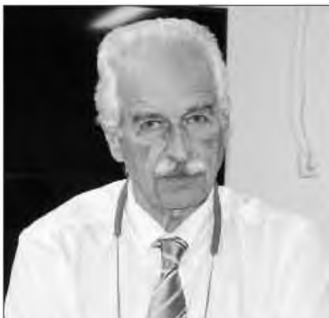
Ο κ. Γουργουλιάνης τόνισε ότι με ψυχραιμία και όχι ακρότητες μπορούν να πειστούν οι υγειονομικοί για να εμβολιαστούν

Και είναι σίγουρο ότι θα πρέπει ο κόσμος να τον ακούει, ώστε να βγάξει και τα σωστά συμπεράσματα, για να αντιμετωπίσει όλη αυτή τη δυσάρεστη εικόνα που εδώ και μεγάλο χρονικό διάστημα έχει δημιουργήσει όλο αυτό το σκηνικό.