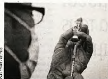
Μέλος Ιατρικού προσωπικού ετοιμάζει δόση του εμβολίου της Moderna, στο Τόκιο

Γεγονός είναι πάντως πως ολόένα και περισσότερα ανεπτυγμένα κράτη φτάνουν στον στόχο του εμβολιασμού ενός 70%-80% του ενήλικου πληθυσμού τους, η προσοχή λοιπόν και μαζί της οι διαφορές μετατοπίζονται στην ανάγκη για ενισχυτικό εμβολιασμό, την επονομαζόμενη «τρίτη δόση». Ακόμα και ο ΠΟΥ έχει εκφράσει αβεβαιότητα όσον αφορά αυτό το ζήτημα. Σε μια συνέντευξη Τύπου που είχαν παραχωρήσει στις 18 Αυγούστου, ανώτεροι αξιωματούχοι του Οργανισμού είχαν επαναλάβει την ανάγκη εμβολιασμού των ευπαθών ανθρώπων σε ολόκληρο τον κόσμο πριν χορηγηθούν ενισχυτικές τρίτες δόσεις στις χώρες με υψηλότερα εισοδήματα. Προχθές, όμως, ο δρ Χανς Κλούγκε, ο περιφερειακός διευθυντής του ΠΟΥ για την Ευρώπη, είπε κάτι διαφορετικό: «Μια τρίτη δόση εμβολίου δεν είναι μια ενισχυτική πολυτέλεια η οποία στερείται από κάποιον που περιμένει ακόμα την πρώτη δόση... Είναι βασικά ένας τρόπος να παραμείνουν οι πλέον ευάλωτοι ασφαλείς».