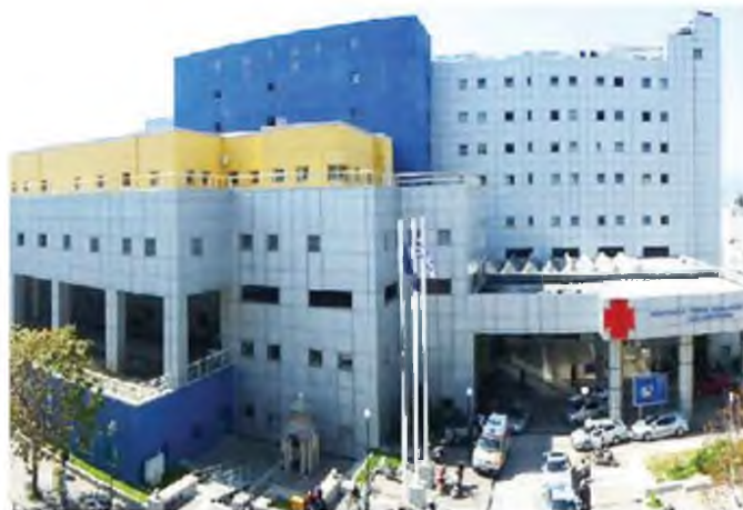
Αρκετοί υγειονομικοί υπάλληλοι στο Αχιλλοπούλειο αναθεώρησαν τις τελευταίες μέρες τη στάση τους και έσπευσαν να προγραμματίσουν ραντεβού για εμβολιασμό

Εάν δεν εμβολιαστούν θα υπάρξει επιστροφή του μισθού, που έχει προκαταβληθεί στα τέλη Αυγούστου περί τις 10 Σεπτεμβρίου, ενώ όσοι θεθούν σε αναστολή εργασίας δεν είναι βέβαιο ακόμη και αν επιλέξουν να εμβολιαστούν μετά-ότι θα επιστρέψουν στις ίδιες θέσεις, δεδομένου ότι ο χαρακτήρας, οι ανάγκες και οργάνωση του ΕΣΥ ως ένα βαθμό θα έχουν αλλάξει. Στο ενδεχόμενο να μείνουν ακάλυπτα τμήματα