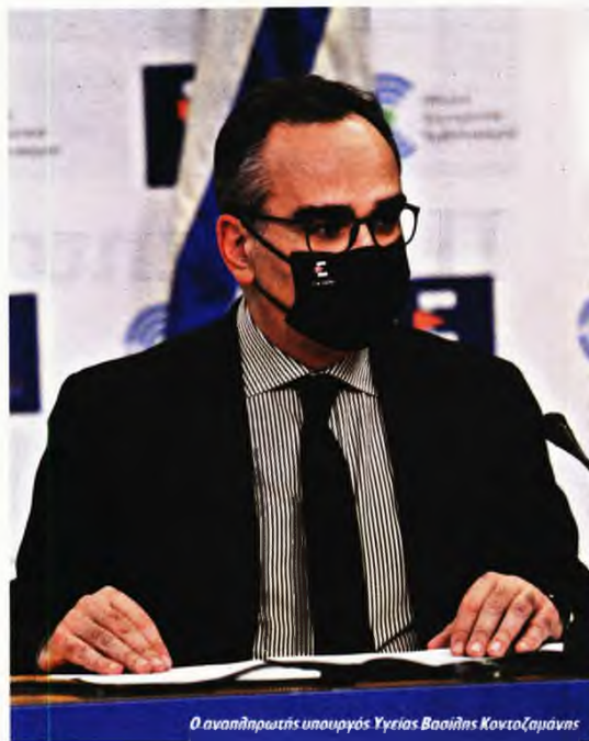
Ο αναπληρωτής υπουργός Υγείας Βασίλης Κοντοζαμάνης

Η κυβέρνηση επιμένει στην αναστολή εργασίας των ανεμβολίαστων υγειονομικών και ανοίγει πλατφόρμα για προσλήψεις συμβασιούχων που θα τους αντικαταστήσουν • Περισσότερο χρόνο ζητεί η ΠΟΕΔΗΝ • Διάλογο της κυβέρνησης με τους εργαζόμενους προτείνει ο τομεάρχης του ΣΥΡΙΖΑ Α. Ξανθός • Προβλέψεις από το ΑΠΘ για 60 θανάτους και 7.000-8.000 κρούσματα τη μέρα από την επόμενη εβδομάδα