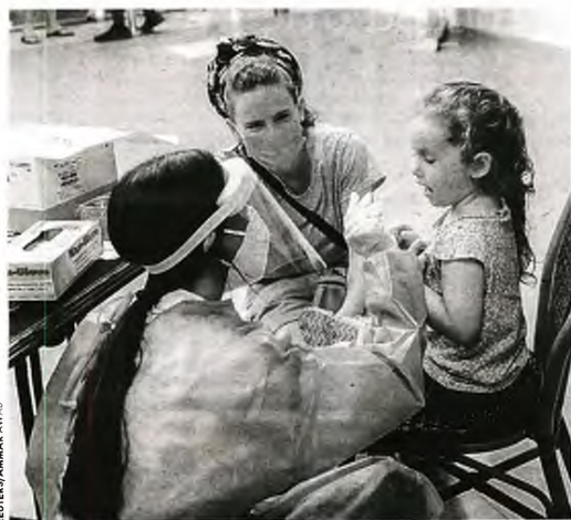
Νοσοκόμα παίρνει δείγμα για ράπιντ τεστ σε κοριτσάκι, σε κέντρο ελέγχου για τον κορωνοϊό, στην Ιερουσαλήμ

στα «ΝΕΑ» ότι αντίστοιχο πρόβλημα αντιμετωπίζει και το Κέντρο Υγείας στην Πύλο, όπου υπηρετεί μόνον ένας ανεμβολίαστος μικροβιολόγος. «Αντίστοιχα, στην Έδεσσα αποχωρεί ο ένας εκ των δύο νεφρολόγων ενώ παράλληλα υπάρχει μεγάλη ανησυχία και για τους αναισθησιολόγους που υπηρετούν ανά τη χώρα», προσθέτει. Πάντως, υπό τις εξελίξεις αυτές εκφράζει την ελπίδα ότι έστω στην ύστατη στιγμή «η νέα ηγεσία του υπουργείου Υγείας θα προχωρήσει σε παράταση του μέτρου της υποχρεωτικότητας. Άλλωστε, έχει φανεί ότι η