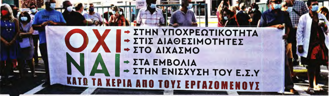
Διαμαρτυρία στο νοσοκομείο ΑΧΕΠΑ ενάντια στην υποχρεωτικότητα των εμβολιασμών στο υγειονομικό προσωπικό

Οι εμβολιασμένοι υγειονομικοί από σήμερα επιμύζονται όλο το βάρος με τη μείωση του προσωπικού ● Οι αντιδράσεις κλιμακώνονται με κινητοποιήσεις πανελλαδικά ● Σε ποια νοσοκομεία υπάρχει σοβαρό πρόβλημα