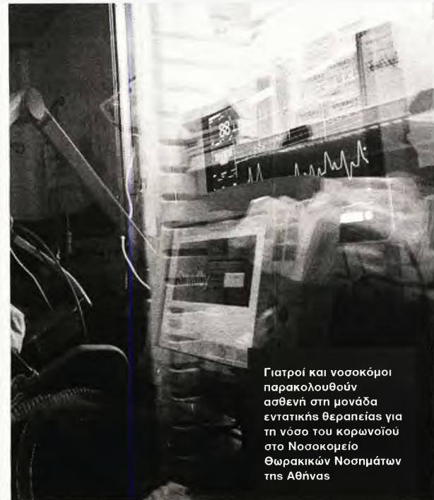
Γιατροί και νοσοκόμοι παρακολουθούν ασθενή στη μονάδα εντατικής θεραπείας για τη νόσο του κορωνοϊού στο Νοσοκομείο Θωρακικών Νοσημάτων της ΑΘΥΑ