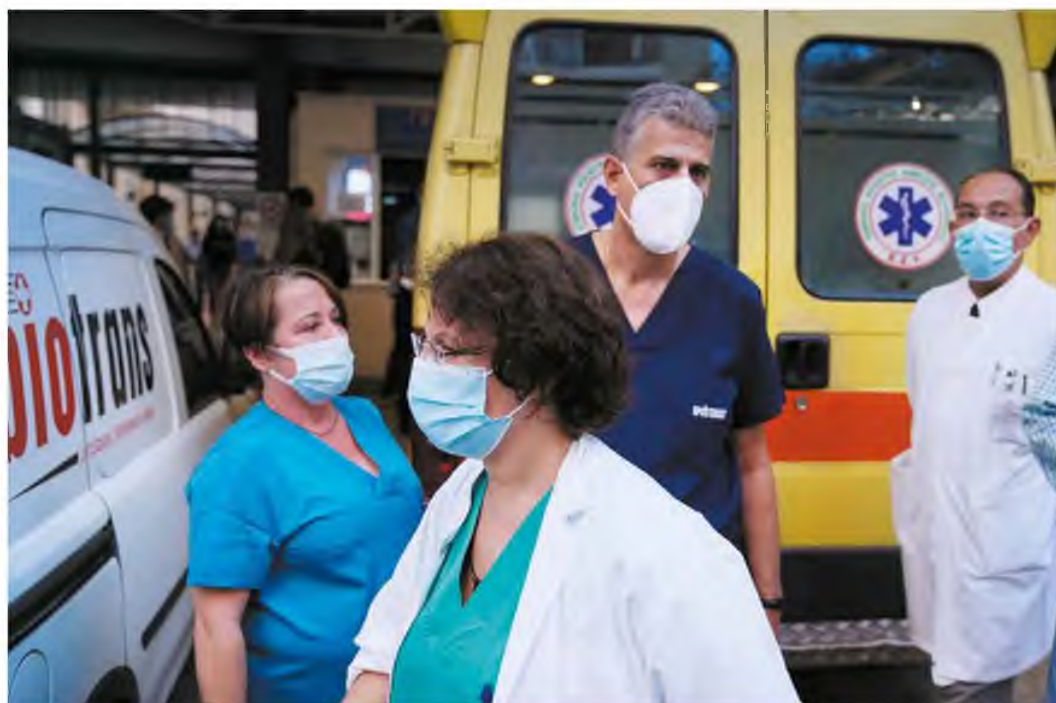
Η χθεσινή ημέρα κύλησε ομαλά, χωρίς να σημειωθούν μη διαχειρίσιμα προβλήματα στη λειτουργία των κλινικών τμημάτων των νοσοκομείων, σύμφωνα με όσα ανέφεραν στην «Κ» υπηλύβαθα στελέχη του υπουργείου Υγείας.

Όπως ανέφεραν στην «Κ» υπηλύβαθα στελέχη του υπουργείου Υγείας, η χθεσινή ημέρα κύλησε ομαλά χωρίς να σημειωθούν μη διαχειρίσιμα προβλήματα στη λειτουργία των