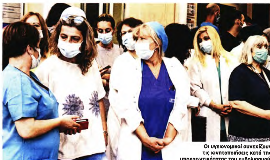
Οι υγειονομικοί συνεχίζουν τις κινητοποιήσεις κατά της υποχρεωτικότητας του εμβολιασμού.

Σε σύνολο περίπου 115.000 εργαζομένων, εγκατέλειψαν τις θέσεις τους περίπου 10.000