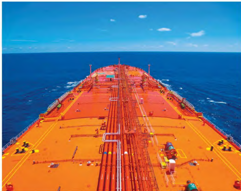
Οι Έλληνες πλοιοκτήτες συνεχίζουν να επενδύουν σε νέα και ενεργειακά αποδοτικά πλοία, με τη μέση ηλικία του ελληνόκτητου στόλου (9,54 έτη) να είναι χαμηλότερη από αυτήν του παγκόσμιου στόλου (9,87 έτη).

Η Εταιρεία Κοινωνικής Προσφοράς Ελληνικού Εφοπλισμού «ΣΥΝ-ΕΝΩΣΙΣ» συνεχίζει με αμείωτο ρυθμό το πολυδιάστατο κοινωφελές έργο της. Υλοποιεί με συνέπεια όλα τα προγράμματα που είχε εξαγγείλει σε τομείς όπως δημόσια υγεία, παιδεία, εθνική άμυνα και προστασία του πολίτη, ενώ προωθεί συνεχώς νέες δράσεις, ανταποκρινόμενη στις αυξανόμενες ανάγκες του κοινωνικού ιστού και υπηρετώντας πιστά το όραμα της ναυτιλιακής οικογένειας, να είναι ουσιαστικός αρωγός στην κοινωνία. Στη νέα δεκαετία που ήδη διανύουμε θα τεθούν νέες παράμετροι για τη λειτουργία της διεθνούς ναυτιλίας, τόσο ως προς το περιβαλλοντικό αποτύπωμα αυτής, αλλά και ως προς την ανταγωνιστικότητά της, δύο στόχοι