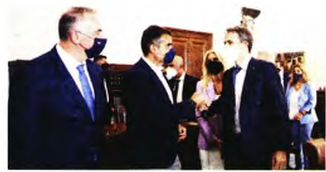
Ο πρωθυπουργός, Κυριάκος Μητσοτάκης, κατά τη συνάντησή του με φορείς και βουλευτές της Ν.Δ. στη Θεσσαλονίκη.

Ο ΣΒΕ Από πλευράς ΣΒΕ (Σύνδεσμος Βιομηχανιών Ελλάδος) κατατέθηκαν τέσσερις δέσμες προτάσεων για την επαναφορά της μεταποίησης στο επίκεντρο της αναπτυξιακής διαδικασίας, που αφορούν τη μείωση του λειτουργικού κόστους, την ενίσχυση των παραγωγικών επενδύσε-