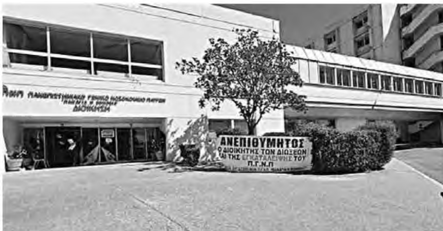
Στην είσοδο από την χθεσινή κατάληψη στα γραφεία της διοίκησης του ΠΓΝΠ από τους εργαζόμενους