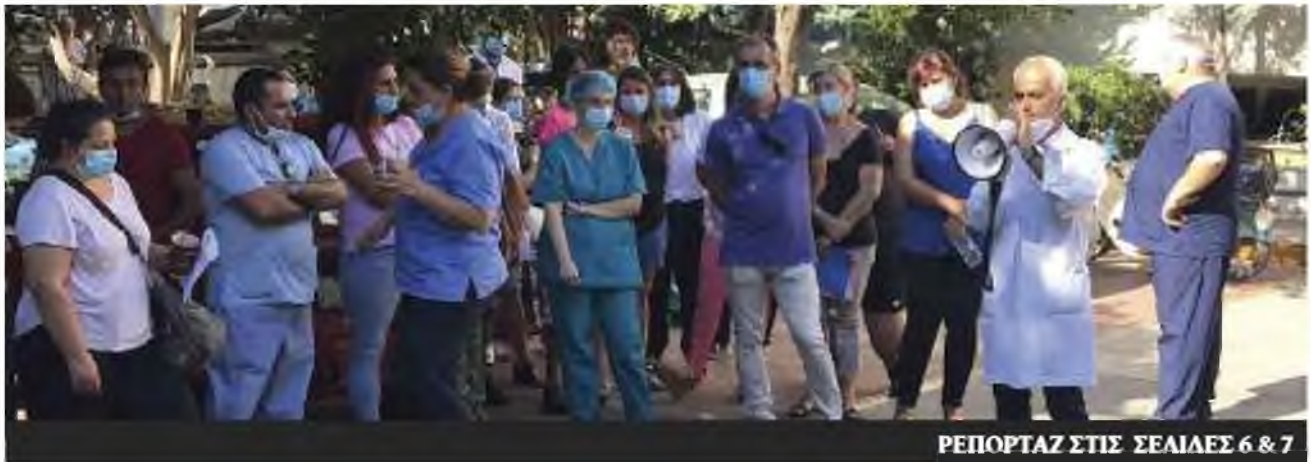
ΡΕΠΟΡΤΑΖ ΣΤΙΣ ΣΕΛΙΔΕΣ 6 & 7