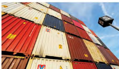
Η κρίση στην παγκόσμια εφοδιαστική αλυσίδα αποτελεί τον βασικό παράγοντα ανασχεσης στην πορεία της μεταποίησης.

Συγκεκριμένα, ο δείκτης PMI έκλεισε στις 59,3 μονάδες τον Αύγουστο από τις 57,4 του Ιουλίου, με την αύξηση της παραγωγής να είναι η υψηλότερη που έχει καταγραφεί από τον Απρίλιο του 2000. Η Ελλάδα, ωστόσο, ως μικρότερη και ιδιαίτερη οικονομία, εθίσθη να έπεται του παγκόσμιου οι-