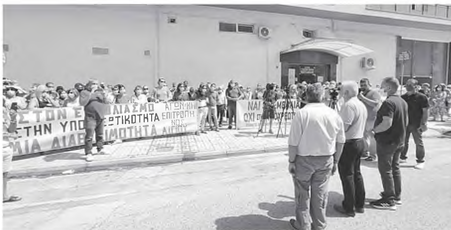
Πέφτει σε δικαστικό τοίχο το διάδημα των υγειονομικών-αρνητών

Στο σκεπτικό των αποφάσεων της Επιτροπής Αναστολών του Συμβουλίου της Επικρατείας (ΣτΕ) με τις οποίες απορρίπτονται οι αιτήσεις που είχαν καταθέσει γιατροί, νοσηλευτές και υπάλληλοι σε δομές υγείας, αναφέρεται πως: «Ο εμβολιασμός επιβάλλεται για λόγους προστασίας της δημόσιας υγείας από την εξάπλωση του κορονοϊού στους νοσηλευόμενους που αποτελούν ιδιαίτερως ευ-