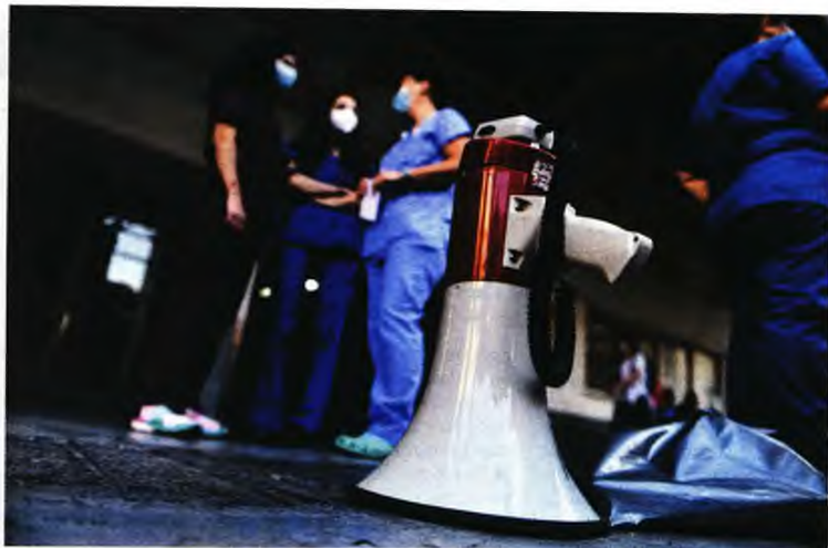
ΕΥΡΩΚΙΝΗΣΗ / ΤΑΤΙΑΝΑ ΜΠΟΥΛΙΑΡΗ

Από νωρίς χθες εργαζόμενοι συγκεντρώθηκαν έξω από τα νοσοκομεία όλης της χώρας ενάντια στη στέρση μισθού για τους ανεμβολίαστους ● Η εφαρμογή του μέτρου έφερε αλαλούμ από την πρώτη μέρα ● Πολλοί ήταν εκείνοι που ως ένδειξη διαμαρτυρίας για την αποψίλωση των υγειονομικών μονάδων της χώρας δεν παρέδωσαν πιστοποιητικά εμβολιασμού