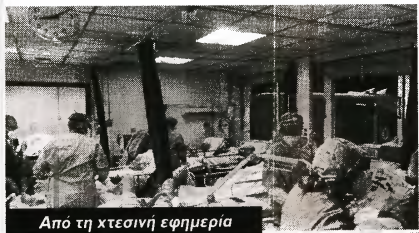
Από τη χτεσινή εφημερίδα

Ιατρείο COVID στο Τμήμα Επειγόντων Περιστατικών του Νοσοκομείου «Ευαγγελισμός», χτες Τετάρτη, ώρα 21:40.