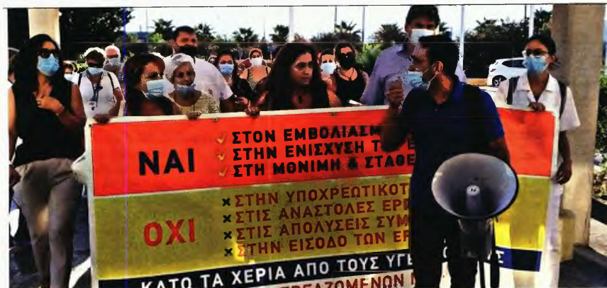
Του ΜΑΡΙΟΥ ΔΙΟΝΕΛΛΗ

ΠΕΡΙΠΟΥ 500 ΕΡΓΑΖΟΜΕΝΟΙ στα νοσοκομεία της Κρήτης αναμένεται συνολικά να τεθούν σε αναστολή εργασίας επί συνόλου 6.500 υπηρετούντων σε όλες τις Μονάδες Υγείας στο νησί. Το ποσοστό των αρνούμενων να εμβολιαστούν (περίπου 7%) είναι χαμηλότερο σε σχέση με άλλες περιοχές της χώρας, ωστόσο έχει σημασία και η κατανομή των κενών που θα δημιουργηθούν, ιδιαίτερα στα μικρότερα νοσοκομεία, όπως του Λασιθίου και του Ρεθύμνου. Χθες στα νοσοκομεία των Χανίων και του Αγίου Νικολάου αλλά και στο Πανεπιστημιακό Νοσοκομείο Ηρακλείου πραγματοποιήθηκαν μαζικές συγκεντρώσεις διαμαρτυρίας στις οποίες συμμετείχαν όχι μόνο οι εργαζόμενοι που πρόκειται να τεθούν σε αναστολή αλλά και μεγάλοι αριθμοί συναδέλφων τους που έχουν ήδη εμβολιαστεί, αλλά διαμαρτυρούνται για