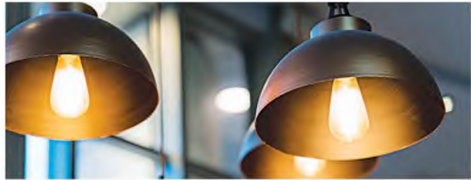
Νέα κλίμακα αποδοτικότητας προβλέπει μεταξύ άλλων η ενεργειακή ετικέτα για λαμπτήρες.