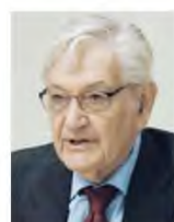
Του Αθαν. Χ. Παναγόπουλου

Δεν είναι λίγες οι επιχειρήσεις που υποφέρουν από τις ασφρυκτικές πιέσεις της άνοδου των διεθνών τιμών σε αρκετές πρώτες ύλες.