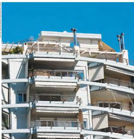
Οι περίπου 6,3 εκατομμύρια υπόχρεοι πληρωμής του ΕΝΦΙΑ 2021 θα λάβουν λίγο μετά τις 16 Σεπτεμβρίου τα εκκαθαριστικά σημειώματα για εξόφληση σε έξι μηνιαίες δόσεις.