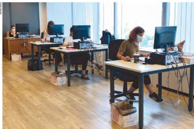
Εργαζόμενοι στη δομή ταχείας απονομής συντάξεων διαδοχικής ασφάλισης του e-ΕΦΚΑ.

Τα υπολοιπα στοιχεία του Συστήματος «Ατλας» δείχνουν ότι από μήνα σε μήνα αυξάνονται οι απονομές συντάξεων. Τον φετινό Ιούνιο εκδόθηκαν 18.753 αποφάσεις για χορήγηση κύριας σύνταξης, όταν τον ίδιο μήνα του 2020 είχαν εκδοθεί 12.170 και το 2019 είχαν εκδοθεί 9.536 αποφάσεις. Ουσιαστικά, φαίνεται ότι τον φετινό Ιούνιο η αύξηση στην ολοκλήρωση των αιτημάτων απο-