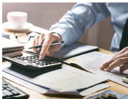
Οι διασταυρώσεις στοιχείων θα αρχίσουν με το πέρας της υποβολής των φετινών φορολογικών δηλώσεων και των εντύπων Ε3.

Εκτός όμως από τα συγκεκριμένα ΑΦΜ, στο «μικροσκοπιο» μπαίνουν ακόμη όλες εταιρείες «διόρθωσαν» τους τόκους τους για το 2019, ούτως ώστε να εντοπιστούν επαγγελματίες που ενό-