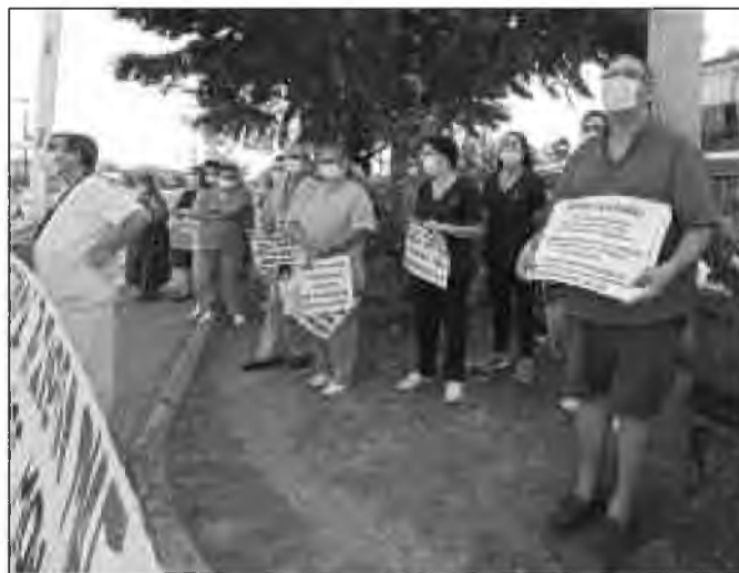
Η Ομοσπονδία προγραμματίζει νέες κινητοποιήσεις με αίτημα κανένας εργαζόμενος «να μη χάσει τη δουλειά του»

την πλήρη αποδιοργάνωση του Εθνικού Συστήματος Υγείας με το μέτρο της υποχρεωτικότητας που επιβλήθηκε χωρίς λόγο. Δεν πρόκειται να δεχθούμε συγχωνεύσεις, καταργήσεις, ιδιωτικοποιήσεις του ΕΣΥ. Από 1η Σεπτεμβρίου το ΕΣΥ θα βρίσκεται σε τραγικό αδιέξοδο» τονίζει η ΠΟΕΔΗΝ.