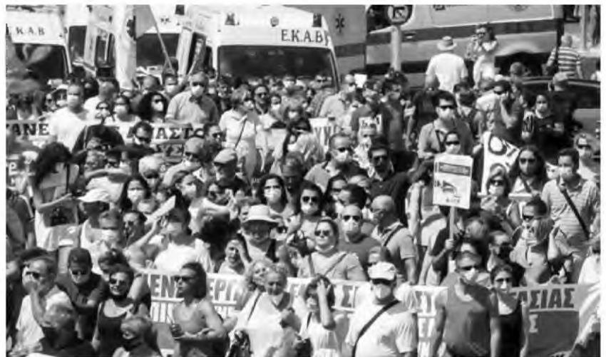
Με δήλωσή του ο Θάνος Πλεύρης διαμνύνει στους ανεμβολίαστους υγειονομικούς ότι μπορούν να επιστρέψουν άμεσα στα καθήκοντά τους, αρκεί να εμβολιαστούν

Δεδομένου, όμως, ότι δεν έχουμε τιμωρητική διάθεση, με τροπολογία που προωθούμε, δίνουμε τη δυνατότητα σε όσους υγειονομικούς εμβολιαστούν από εδώ και στο εξής με την πρώτη δόση, να αρθεί το καθεστώς της αναστολής και να επιστρέψουν άμεσα στη δουλειά τους με την προϋπόθεση της ολοκλήρωσης του εμβολιασμού τους».