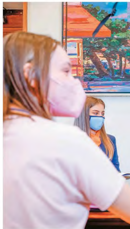
Στιγμιότυπο από τη συνάντηση του Αλέξη Τσίπρα με αντιπροσωπία της Βουλής των Εφήβων

Μ ετά το 2018 ο φετινός Σεπτέμβριος είναι ο καλύτερος για τον Αλέξη Τσίπρα. Για πρώτη φορά τα προβλήματα είναι της κυβέρνησης και όχι της αντιπολίτευσης. Τόσο πέφτει όσο και πρόπερι ο ερχομός του φθινοπώρου είχε πολλές... βροχές για την Κουμουνδούρου. Η εσοστρέφεια, οι αρνητικές δημοσκοπήσεις, το ισχυρό αντι-ΣΥΡΙΖΑ μέτωπο, τα «40άρια» του Μητσοτάκη ήταν καρφιά στο ασθενικό σώμα του ΣΥΡΙΖΑ. Σχεδόν όλοι προέβλεπαν μια «δεύτερη άνετη νίκη της Ν.Δ. στις εκλογές, όπως κι αν στήνονταν οι κάλπες» και προσεφύουσαν μια «σίγουρη οκταετία του Κυριάκου». Τα σενάρια για τον ΣΥΡΙΖΑ ήταν μαύρα, μαύρα σαν καλιακούδα: από επιστροφή στο 3% μέχρι αναζήτηση του διαδόχου του Τσίπρα προέβλεπαν οι «προφήτες της συμφοράς», όπως αποκαλεί ο αρχηγός της αξιωματικής αντιπολίτευσης ορισμένους δημοσκόπους και δημοσιογράφους.