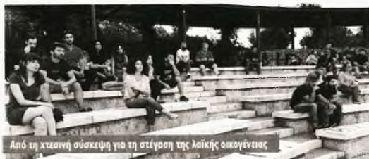
Από τη χθεσινή συζήτηση για τη στέγαση της λαϊκής οικογένειας

Οι αυξήσεις αυτές επιβαρύνουν ιδιαίτερα και τον φοιτητικό πληθυσμό της πόλης που ξεπερνά τους 156.000 και από