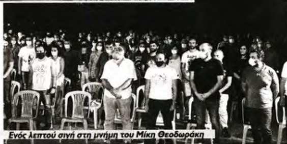
Ενός λεπτού σιγή στη μνήμη του Μίκη Θεοδωράκη

αυτών που βγήκαν σε αναστολή, ενώ προειδοποίησε ότι έπεται συνέχεια.