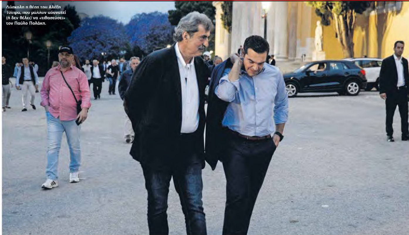
Λύσκαλη η θέση του Αλέξη Τσίπρα, που μάλλον αδυνατεί (ή δεν θέλει) να «θασασέψει» τον Παύλο Πολάκη.

ΑΠΙΣΤΕΥΤΟ ΠΑΡΑΛΗΡΗΜΑ ΚΑΤΑ ΤΩΝ 53+ ΠΟΥ ΔΙΑΦΩΝΟΥΝ ΜΕ ΤΟΝ ΣΥΡΙΖΑ ΓΙΑ ΤΟΥΣ ΕΜΒΟΛΙΑΣΜΟΥΣ