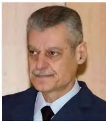
Οι επιλογές Μητσοτάκη αιφνιδίασαν ΣΥΡΙΖΑ και ΚΙΝΑΛ

σεις στο Πυροσβεστικό Σώμα, που θα είναι στην αρμοδιότητά του. Ο ίδιος ξέρει από κρίσεις, εξ ου και επελέγη από τον κ. Μητσοτάκη, με τον οποίο διατηρεί προσωπική σχέση από την εποχή που ο πρωθυπουργός ήταν πρόεδρος της ΝΔ. Πολλές φορές, άλλωστε, οι δυο τους τα έχουν πει κατ' ιδίαν, ενώ στην περίπτωση του κ. Στυλιανίδη εκτιμάται ότι είναι ένας άνθρωπος με μεγάλη εμπειρία, διεθνείς παραστάσεις αλλά και προσήνεια και ικανότητα να ακούει και να μαθαίνει. Παράλληλα, θα είναι αυτός που θα επιβλέψει την αναμόρφωση της Πολιτικής Προστασίας με όπλο και τους πόρους από το Ταμείο Ανάκαμψης.