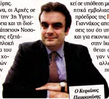
Ο Κυριάκος Πιερρακάκης

Συγκεκριμένα, οι Αρχές σε συνεργασία με την 3η Υγειονομική Περιφέρεια και τη διοίκηση του «Μαμάτσειου» Νοσοκομείου Κοζάνης εξετάζουν αν έχει εμπλοκή και νοσπλεύτρια του ιδρύματος στη χορήγηση πλαστών πιστοποιητικών εμβολιασμού σε συγκεκριμένα άτομα από το «κύκλωμα»