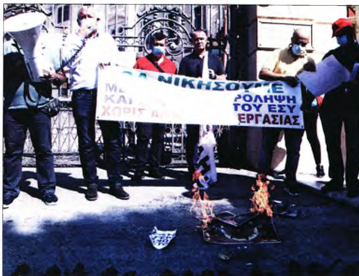
Από τη διαμαρτυρία των υγειονομικών στη Θεσσαλονίκη. Κάτω: Η τούρτα με τη φάτσα του πρωθυπουργού

Δεκάδες μέτρα αναμένεται να αφηρούν οι μείώσεις, ωστόσο «κλειδωμένα» θα πρέπει να θεωρείται η νέα μεσοσταθμική μείωση του ΕΝΦΙΑ κατά 8%, η νέα αναστολή της εισφοράς αλληλεγγύης στους εργαζομένους του ιδιωτικού τομέα. Στο τραπέζι βρίσκεται η περαιτέρω μείωση των ασφαλιστικών εισφορών κατά 0,6 ποσοστιαία μονάδες από την 1η Ιανου-