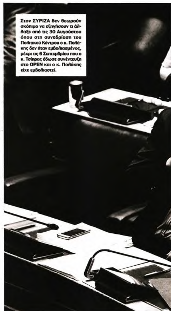
Στον ΣΥΡΙΖΑ δεν θεωρούν σκόπιμο να εξηγήσουν τι άλλαξε από τις 30 Αυγούστου όπου στη συνεδρίαση του Πολιτικού Κέντρου ο κ. Πολάκης δεν ήταν εμβολιασμένος, μέχρι τις 6 Σεπτεμβρίου που ο κ. Τσίπρας έδωσε συνέντευξη στο OPEN και ο κ. Πολάκης είχε εμβολιαστεί.

Πρώτον, διότι έχει έντονα προσωπικά χαρακτηριστικά από τον καιρό που ήταν στο ίδιο υπουργείο και ο ένας έκοβε το κλαδί του άλλου. Δεύτερον, διότι επί της ουσίας πρόκειται για την αέναη κόντρα στο εσωτερικό του ΣΥΡΙΖΑ ανάμεσα στον ορθολογισμό και τον ρεαλισμό από τη μία πλευρά και τον αναρχο-