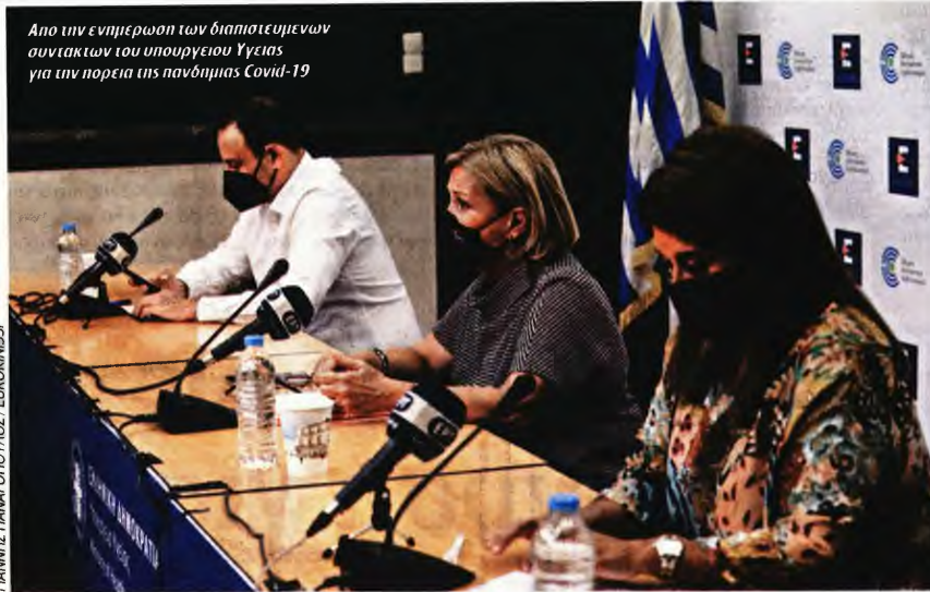
Απο την ενημέρωση των διαπιστευμένων συντακτών του υπουργείου Υγείας για την πορεία της πανδημίας Covid-19