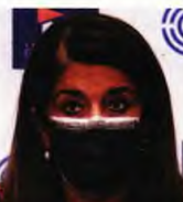
Η καθηγήτρια Παιδιατρικής - Λοιμωξιολογίας ΕΚΠΑ Βάνα Παπαευαγγέλου

Ο υποχρεωτικός έλεγχος των παιδιών δύο φορές την εβδομάδα μέσω self-test βοηθά να μειωθεί η μετάδοση του κορωνοϊού ακόμα περαιτέρω ώστε να πέσει στο 22%. Όπως εξηγεί ο αναπληρωτής καθηγητής Επιδημιολογίας ΕΚΠΑ Δημήτρης Παρασκευάς, η σχολική διασπορά μάς ενδιαφέρει σε δύο άκρες. Αφενός όταν υπάρχει εκτεταμένη διασπορά και καταγράφονται πολλά κρούσματα, κάποια παιδιά στατιστικά θα νοσήσουν βαριά και, αφετέρου, μας ενδιαφέρει και για την αλυσίδα μεταδόσεων στο σπίτι και στους οικείους, εκεί δηλαδή που ο κορωνοϊός μπορεί να φτάσει στους ευπαθείς συγγενείς. Αναφερόμενη στη βέλαινη αύξηση των κρουσμάτων στη σχολική κοινότητα, η καθηγήτρια Παιδιατρικής - Λοιμωξιολογίας ΕΚΠΑ Βάνα Παπαευαγγέλου επισημαίνει πως η ελληνική οικογένεια εμπιστεύεται τον παιδίατρο της. Στα σχέδων 13.000 σχολεία της επικράτειας φοιτούν 1.200.000 παιδιά, εκ των οποίων 600.000 πγαίνουν γυμνάσιο και λύκειο, ανήκουν δηλαδή στις ηλικιακές ομάδες που μπορούν να εμβολιαστούν, εφόσον οι γονείς τους πιστευτούν για την αναγκαιότητα του εμβολιασμού ώστε να διασφαλιστεί η ομαλή σχολική χρονιά.