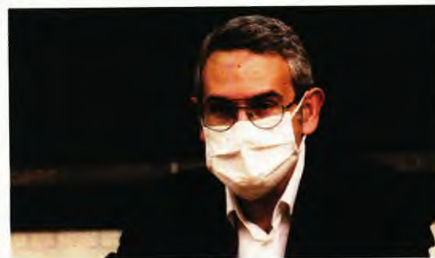
Ο αναπληρωτής καθηγητής Επιδημιολογίας ΕΚΠΑ Δημήτρης Παρασκευάς