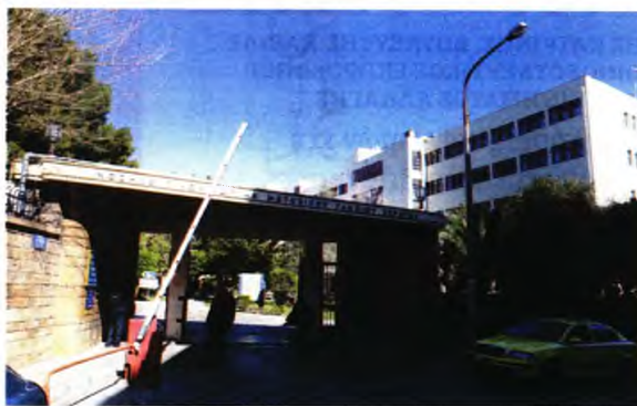
Το νοσοκομείο NIMTZ

Σαρωτικοί έλεγχοι και για περισσότερους από 200 υγειονομικούς