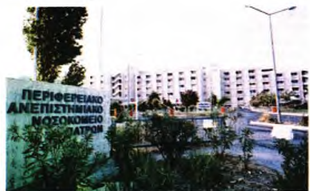
Το Πανεπιστημιακό Νοσοκομείο του Ρίου

Γιατροί και νοσηλεύτριες σε κέντρα υγείας και διαγνωστικά εργαστήρια ακούν κι άλλα παράλογα που παραπέμπουν σε ταινίες επιστημονικής φαντασίας, όπως την άρνηση πολιτών να υποβληθούν σε ρινοφαρυγγικό rapid test, προβάλλοντας το απίστευτο επιχειρήμα ότι η μπατονέτα είναι εμποτισμένη με καρκινογόνες ουσίες που μπορούν να τους προκαλέσουν ανεπανόρθωτα προβλήματα υγείας.