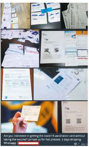
Are you interested in getting the covid 19 vaccination card without taking the vaccine? Contact us for fast process. 3 days shipping. Whatsapp

Το dark web Ο Λιαντ Μιζράχι, ειδικός σε θέματα ασφαλείας στην ισραηλινή εταιρεία Check Point, μελέτα τους