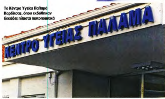
Το Κέντρο Υγείας Παλαμά Καρδίτσας, όπου εκδόθηκαν δεκάδες πλαστά πιστοποιητικά

Του ΓΙΑΓΓΟΥ ΛΥΚΟΥΡΕΝΤΖΟΥ g.lykourantzou@realnews.gr