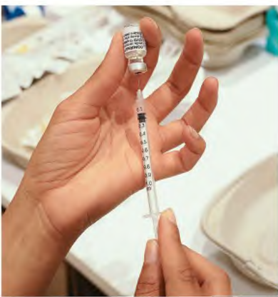
Σε τουλάχιστον επτά περιοχές της χώρας έχουν εντοπιστεί πλαστά πιστοποιητικά εμβολιασμού, με πιο ανησυχητικές τις περιπτώσεις που αφορούν υγειονομικούς (φωτ. αρχείου).