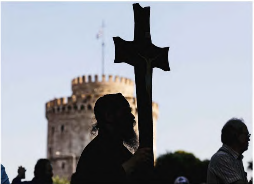
Αντιεμβολιαστικός Μεσοίνας! Πολλοί μοναχοί πρωτοστατούν στα συλλαλητήρια κατά των εμβολίων προβαίνοντας σε ακρότητες επί του πεδίου.

Τι συμβαίνει όμως στα κοινοβία των μοναστηριών, με τις δεκάδες χιλιάδες ρασοφόρους/ες;