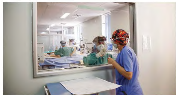
Δεν φτάνει η κούραση και η προσπάθεια να σώσουν ασθενείς, γιατροί και νοσηλευτές σε κλινικές COVID-19 βρίσκονται στην ανάγκη να υπομείνουν την περιπέτεια της δικαστικής εμπλοκής.

Και ιδού το αποτέλεσμα. Υπήρξαν, προς το παρόν, δύο βουλεύματα (αποφάσεις δικαστικών συμβουλίων) που έκριναν ότι, παρά την ύπαρξη των ιατρικών φακέλων, παρά τις προσπάθειες των γιατρών να σωθούν αυτοί οι άνθρωποι, παρά την επιστήμη, παρά τις βεβαιώσεις της Ιατροδικαστικής Υπηρεσίας, πρέπει να γίνει η εκταφή! Οι αρμόδιοι δικαστικοί, δηλαδή, δικαιοσύνη τις μακάβριες πράξεις αντιεμβολιαστών, θυμίζοντας τα «μαύρα» σελίδα της Δικαιοσύνης, όταν δικαστής στο Πρωτοδικείο της Αθήνας είχε δικαιώσει τον Αρτέμη Σώρρα ότι είχε τα διακατομήτρια ευρώ για να σβήσει το χρέος της χώρας! Με αυτή την απόφαση ο Σώρρας γιγαντώθηκε και εξαπάτησε χιλιάδες αφέλιμους που τον χρηματοδότησαν με ό,τι είχαν.