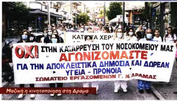
Μαζική η κινητοποίηση στη Δράμα

καν σε αναστολή, με την πανδημία να «τρέχει» και την κυβέρνηση να την αξιοποιεί για την επέκταση των «ελαστικών» εργασιακών σχέσεων, σε βάρος της μόνιμης εργασίας με πλήρη δικαιώματα, την «αντικατάσταση» μόνιμων εργαζομένων με 3μηνίτες, την πλήρη ιδιωτικοποίηση της καθαριότητας, της φύλαξης, της σίτισης, τεχνικών και διοικητικών υπηρεσιών κ.ά.