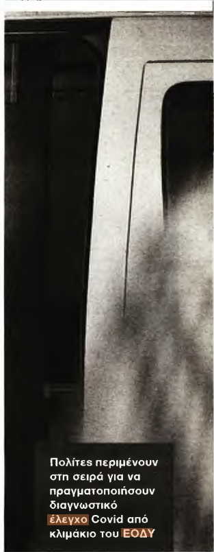
Πολίτες περιμένουν στη σειρά για να πραγματοποιήσουν διαγνωστικό έλεγχο Covid από κλιμάκιο του ΕΟΔΥ

στην προσωπική του σελίδα στο Facebook μία ανάρτηση χρήση των social media, η οποία αναφέρει: «Μην αγοράζετε το iPhone 13. Το ανέπτυξαν σε μόλις ένα χρόνο. Το πρώτο iPhone χρειάστηκε δεκαετομύρια χρόνια να φταχτεί, πώς μπορούμε να εμπιστευτούμε ένα iPhone που αναπτύχθηκε τόσο γρήγορα?».