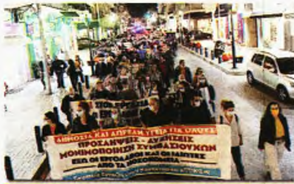
Από τη χτεσινή κινητοποίηση στο Περιστέρι

«Οι συνάδελφοι αυτοί έχουν αποκτήσει πολύτιμη εμπειρία και τυχόν απόλυσή τους - εκτός από το πρόβλημα επιβίωσης που θα δημιουργήσει στους ίδιους και τις οικογένειές τους - θα προκαλέσει σοβαρά προβλήματα στη λειτουργία των μονάδων Υγείας και Πρόνοιας, ιδιαίτερα στη ση-