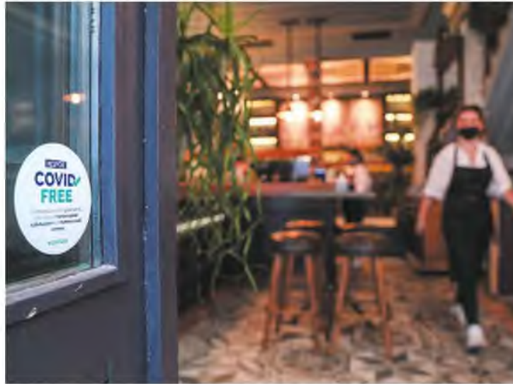
Για τους μεικτούς χώρους εμβολιασμένων και ανεμβολίαστων τα μέτρα θα συνεχίσουν να ισχύουν όπως και σήμερα.

Άρση των περιοριστικών μέτρων για τις «κόκκινες» επιδημιολογικά περιοχές και συγκεκριμένα της απαγόρευσης κυκλοφορίας τις μεταμεσονύχτιες ώρες και της μουσικής σε χώρους εστίασης και διασκέδασης, αλλά και πλήρης ελευθερία για τους θαμώνες στους κλειστούς χώρους διασκέδασης που δέχονται μόνο εμβολιασμένους, ανακοίνωσε χθες η ηγεσία του υπουργείου Υγείας. Σύμφωνα με τα όσα ανακοίνωσαν ο υπουργός Υγείας Θάνος Πλεύρης, η αναπληρώτρια υπουργός Υγείας Μίνα Γκάγκα και ο νέος πρόεδρος του ΕΟΔΥ Θεοκλής Ζαούτης, η σταδιακή επιστροφή στην κανονικότητα για τους εμβολιασμένους ξεκινάει με τα συγκεκριμένα μέτρα από το