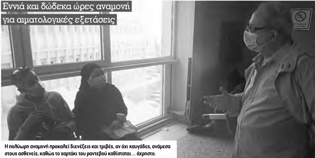
Η πολύωρη αναμονή προκαλεί διενέξεις και τριβές, αν όχι καυγάδες, ανάμεσα στους ασθενείς, καθώς το χαρτάκι του ραντεβού καθίσταται... άχρηστο.

Εννιά και δώδεκα ώρες αναμονή για αιματολογικές εξετάσεις