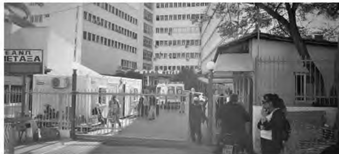
Το νοσοκομείο «Μεταξάς» είναι το ένα από τα μόλις δύο νοσοκομεία για τους καρκινοπαθείς στην Αθήνα και τον Πειραιά. Τώρα προστέθηκαν και οι αναστολές, ενώ οι ανάγκες για νοσηλεία αυξάνονται καθημερινά.

«Την προηγούμενη φορά περίμενα από τις 8 η ώρα και εξυπηρετήθηκα στις 5 το απόγευμα. Για να σε κάνω να καταλάβεις, είναι 3 η ώρα, το χαρτί μου λέει 26 αριθμό και εξυπηρετείται το 9», μας λέει η κυρία Μαρία που περιμένει υπομονετικά στις σκάλες, καθώς καρέκλες και καναπέδες, έχουν ξηλωθεί, προφανώς για να μην συσσωρεύονται οι ασθενείς στον ίδιο χώρο, μπροστά από τη Μονάδα Ημερήσιας Νοσηλείας στο Β' όροφο της κλινικής. Λόγω πανδημίας κορωνοϊού. Οι περισσότεροι καταφεύγουν είτε στο προαύλιο είτε οδηγούνται απ' το προσωπικό του νοσοκομείου στο αμφιθέατρο, καθώς συνήθως, νωρίς το πρωί, οι σκάλες είναι το μόνο σημείο που προσφέρεται για να ξεπαστώσει κανείς