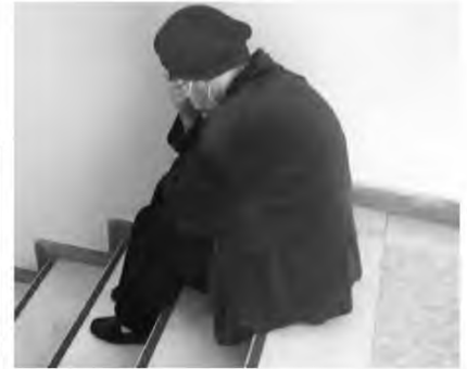
Πλήρης απόγνωση. Ήρθε στις 8 το πρωί και δεν ξέρει καν αν θα περάσει για νοσηλεία έστω και στις 5 το απόγευμα.

«κήρυγμα» από τον ευνοημένο ασθενή ότι δεν φταίει το νοσοκομείο, αλλά το γεγονός ότι... οι ασθενείς είναι πολλοί, ότι οι αιματολογικές εξετάσεις παίρνουν 2,5 ώρες για να βγουν και χρειάζεται έπειτα η διαδικασία του φαρμακείου που β' αναμειξεί τα φάρμακα και άλλα τέτοια. Μάλιστα παρ' όληγον τα πράγματα να αγριέψουν όταν ο ηλικιωμένος ασθενής, ανέφερε ότι τα... ραντεβού, δεν σημαίνουν ότι θα σε δουν κιόλας οι γιατροί στην προγραμματισμένη ώρα. Τα χειρότερα αποφεύχθηκαν, χάρη στη σχεδόν παροιμιώδη ψυχραιμία του νεαρού, ο οποίος μάλιστα δεν ήθελε και καυγάδες, αλλά δεν μπορούσε να σιωπήσει κιόλας επειδή τον έπνιγε το δίκιο, και την παρέμβαση της μητέρας του, που φαινόταν να νονούσε περισσότερο ακόμη με τη φασαρία που γινόταν.