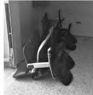
Οι καρέκλες έχουν ξηλωθεί λόγω κορωνοϊού (i) και οι ασθενείς που περιμένουν νοσηλεία περιφέρονται σαν ζώμια στους διαδρόμους για ώρες.