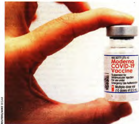
Φιαλίδιο με δόση του εμβολίου της Moderna. Η Σουδηά σταμάτησε τους εμβολιασμούς με το σκεύασμα στους πολίτες κάτω των 30 ετών

Την ίδια ώρα η Εθνική Επιτροπή Εμβολιασμών επεξεργάζεται όλα τα επιστημονικά δεδομένα σχετικά με την αναμνηστική δόση, μετά και το πρόσφατο πράσινο φως του Ευρωπαϊκού Οργανισμού Φαρμάκων (EMA). Μάλιστα, όπως δήλωσε χθες ο κυβερνητικός εκπρόσωπος Γιάννης Οικονομικό, πολύ σύντομα θα ληφθούν αποφάσεις με στόχο η τρίτη δόση να είναι διαθέσιμη σε όλους πριν από το τέλος του έτους.