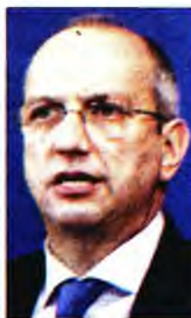
Ο Γιάννης Οικονόμου

Το βασικότερο ερώτημα στο οποίο καλείται να απαντήσει η κυβέρνηση, όμως, είναι αν πλήρως εμβολιασμένος -και άρα προστατευμένος- είναι αυτός που έχει κάνει τις δύο ή τις τρεις δόσεις. Και αυτό διότι, μέχρι στιγμής, ισχυρίζονται το πρώτο, αν και συστήνουν στον κόσμο να κάνει την τρίτη δόση... Νωρίτερα, ο κυβερνητικός εκπρόσωπος είχε επισημάνει ότι οι εμ-