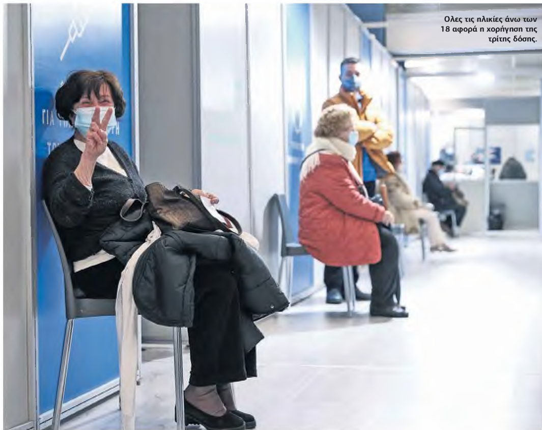
Όλες τις ηλικίες άνω των 18 αφορά η χορήγηση της τρίτης δόσης.

ΜΟΝΟ ΜΕ RAPID ΤΕΣΤ ΣΕ ΔΗΜΟΣΙΟ, ΤΡΑΠΕΖΕΣ, ΛΙΑΝΕΜΠΟΡΙΟ, ΚΟΜΜΩΤΗΡΙΑ, ΕΞΩΤΕΡΙΚΟΥΣ ΧΩΡΟΥΣ ΕΣΤΙΑΣΗΣ