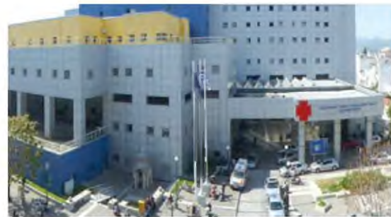
Συγκέντρωση διαμαρτυρίας πραγματοποιούν σήμερα οι υγειονομικοί που βρίσκονται εκτός εργασίας επειδή είναι ανεμβολίαστοι

Επισημαίνει επίσης ότι οι ελλείψεις προσωπικού έχουν προκαλέσει έμφραγμα στα νοσοκομεία, αναφέρει πως οι αναστολές εργασίας έχουν προκαλέσει τραγικό λειτουργικό αδιέξοδο στο ΕΣΥ, με αποτέλεσμα τα νοσοκομεία πλέον να λειτουργούν στο κόκκινο, ενώ την ίδια ώρα ο ιδιωτικός τομέας συνεχίζει να μένει ανέγγιχτος και αμόλυντος από περιστατικά κορονοϊού.