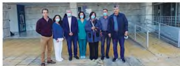
Το Σωματείο Εργαζομένων «Ασκληπιός» του Νοσοκομείου Αιγίου

Συνάντηση γνωριμίας με τον πρόεδρο της Πανελλήνιας Ομοσπονδίας Εργαζομένων Δημοσίων Νοσοκομείων Μιχάλη Γιαννακό είχε η νέα διοίκηση του Σωματείου Εργαζομένων του Νοσοκομείου Αιγίου, με εύσημα προς τη διοίκηση για την προσπάθεια προμήθειας ιατροτεχνολογικού εξοπλισμού, την ήδη λειτουργία Ενδοσκοπικού - Γαστρεντερολογικού Μηχανήματος, Μαστογράφου (3D) και Καρδιολογικού Υπέρηχου, αλλά και εκτεταμένες παρεμβάσεις στις κτιριακές υποδομές, για αξιοπρέπεια και ασφάλεια.