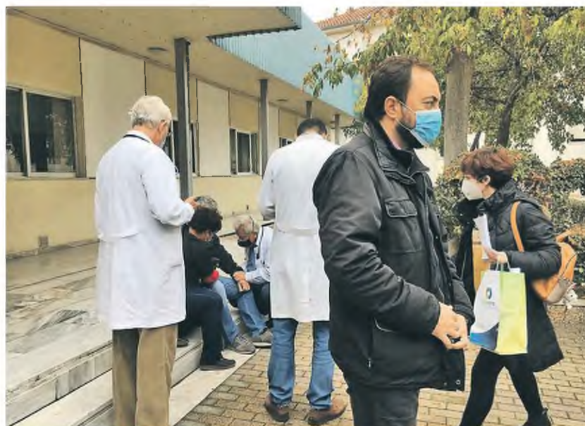
Κατέρρευσε μπροστά στις κάμερες ο διευθυντής της κλινικής Covid στη Λάρισα και μεταφέρθηκε στην καρδιολογική κλινική, όπου υποβλήθηκε σε εξετάσεις

των. Συνολικά νοσηλεύονται πλέον στο ΑΧΕΠΑ 105 ασθενείς στις απλές κλινικές Covid και 15 στις ΜΕΘ. Την ίδια ώρα στο «Πρ-