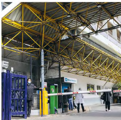
Οι εκπρόσωποι των γιατρών και των εργαζομένων κάνουν λόγο για αυξημένη ζήτηση παρόχης φροντίδας στην Αττική από τον COVID περιστατικά, με αποτέλεσμα να αναπτύσσονται ράντζα στις εφημερίες των νοσοκομείων.