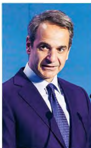
Ο κ. Μητσοτάκης συναντήθηκε χθες στο Μαξίμου με τους εκπροσώπους των φορέων εμπορίου και εστίασης.

Ο τρίτος άξονας στον οποίο κινείται η κυβέρνηση είναι η ενίσχυση του ΕΣΥ. Χθες, ο Γιάννης Οικονόμου άφησε ανοικτό το ενδεχόμενο επίταξης ιατρών, καθώς το ΕΣΥ «δέχεται ισχυρή πίεση, παρά την εντυπωσιακή του ενίσχυση τους τελευταίους 18 μήνες». Τόνισε δε, πως τόσο σε ευρωπαϊκό όσο και σε εθνικό επίπεδο η αύξηση των κρουσμάτων είναι αντιστρό-