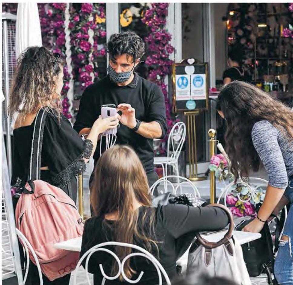
Η προεμίερα των νέων μέτρων το περασμένο Σαββατοκύριακο συνοδεύτηκε από σαρωτικούς ελέγχους που έφτασαν τις 90.882, ενώ βεβαιώθηκαν 594 παραβάσεις.

Με αυτόν τον τρόπο υποστηρίζεται και ο δεύτερος βασικός, αν όχι βασικότερος, στόχος της κυβέρνησης που είναι η αύξηση του εμβολιασμού. Την τελευταία εβδομάδα παρατηρείται υπερδιπλασιασμός των ραντεβού για την πρώτη δόση, αποτέλεσμα τόσο των μέτρων όσο και της ραγδαίας αύξησης των κρουσμάτων, ενώ και τα ραντεβού για την τρίτη δόση εξελίσσονται ικανοποιητικά. «Θέλω να τονίσω ότι η πολιτική την οποία υιοθετήσαμε την τελευταία εβδομάδα φαίνεται να αποδίδει. Είχαμε 140.000 καινούργια ραντεβού, ραντεβού πρώτης δόσης και σχεδόν 200.000 ραντεβού τρίτης δόσης» είπε ο πρωθυπουργός στη συσκέψη με τους ανθρώπους της αγοράς.