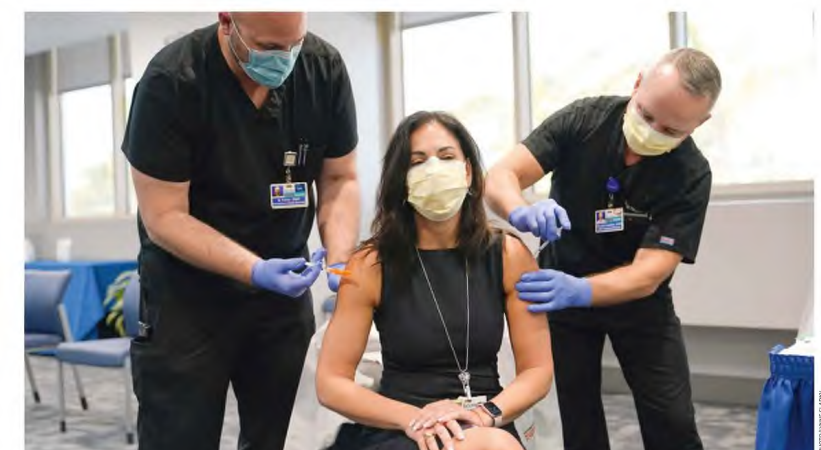
Σε μια περίοδο που ο αντιγηρικός εμβολιασμός συμπληρεί χρονικά με τη χορήγηση της 3ης δόσης του εμβολίου έναντι του κορωνοϊού, οι ειδικοί επιστήμονες ότι το εμβόλιο θα μπορούσαν να γίνουν ακόμη και την ίδια ημέρα, σε διαφορετικά ανατομικά σημεία (στημιότυπο από εμβολιασμό Ιατρού στις ΗΠΑ).

γώγεις νέων ασθενών σε νοσοκομεία έναντι 359 εισιτηρίων λόγω της με το ποσοστό κάλυψης των απλών κλινών COVID της επικράτειας να φτάνει στο 60,5% και των κλινών ΜΕΘ στο 92%. Εκκλίνον στους πολίτες να μην αργούν να ζητούν ιατρική φροντίδα και τη δεύτερη με τρίτη ημέρα μετά την εμφάνιση των συμπτωμάτων να έχουν δει γιατρό και να έχουν κάνει τις απαραίτητες εξετάσεις απιθύνητες χθες η αναπληρώτρια υπουργός Υγείας, Μίνα Γκκάγκα (τηλεοπτικός σταθμός Mega). Όπως ανέφερε, «υπάρχει πίεση στο ΕΣΥ, αλλά όχι η μεγαλύτερη που έχουμε χθες σε αυτή την πανδημία». Πρόσθεσε, ωστόσο, ότι το προσωπικό των νοσοκομείων είναι κουρασμένο έπειτα από τόσα διαδοχικά κύματα της πανδημίας. «Χρειάζομαστε τη βοήθεια των ιδιωτών γιατρών και κλινικών την οποία έχουμε, και το πολύ σημαντικό είναι να μην αργούν οι ασθενείς να αναζητήσουν ιατρική φροντίδα, για να μη βλέπουμε στα νοσοκομεία πολύ βαριά περιστατικά αργά, τα οποία δεν μπορούμε να αναστρέψουμε».