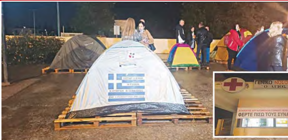
Παραμένουν σε σκηνές έξω από το Νοσοκομείο Χανίων υγειονομικοί που έχουν τεθεί σε αναστολή γιατί δεν έχουν εμβολιαστεί.