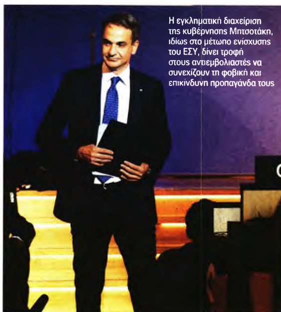
Η εγκληματική διαχείριση της κυβέρνησης Μπυσσάκη, ιδίως στο μέτωπο ενίσχυσης του ΕΣΥ, δίνει τροφή στους αντιεμβολιαστές να συνεχίζουν τη φοβική και επικίνδυνη προπαγάνδα τους

Προφανώς δεν ευθύνονται τα εμβόλια για τους θανάτους, τα οποία αντιθέτως σώζουν ζωές, ωστόσο η εγκληματική διαχείριση της κυβέρνησης, ιδίως στο μέτωπο ενίσχυσης του ΕΣΥ, δίνει τροφή τους αντιεμβολιαστές να συνεχίζουν τη φοβική και επικίνδυνη προπαγάνδα τους στα social media.