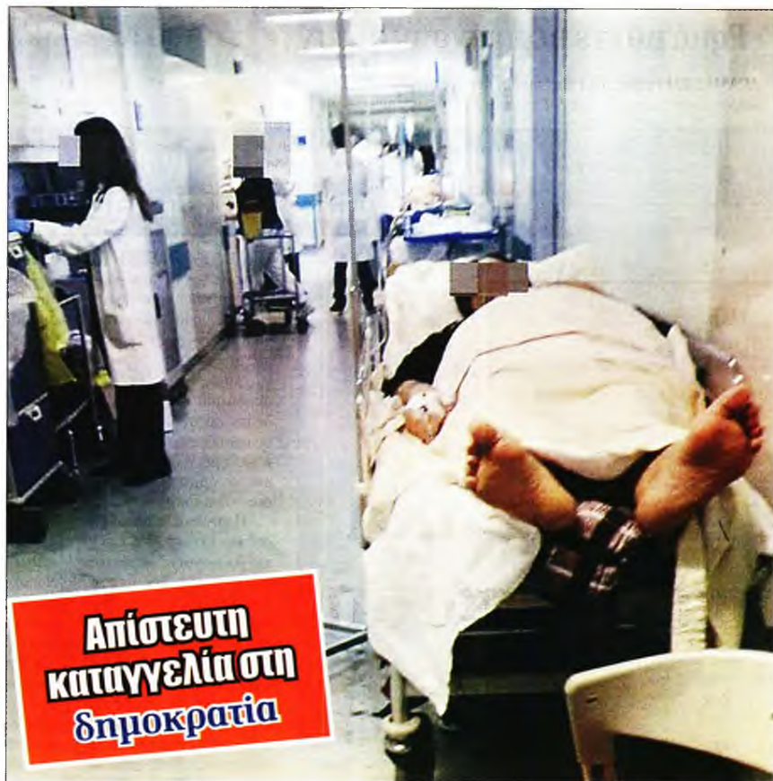
Γεμάτοι με ράντσα οι διάδρομοι στο Νοσοκομείο Αττικόν

Εκεί, όπου υπό κανονικές συνθήκες ο έλεγχος θα έπρεπε να τηρείται ευλαβικά, δεδομένου ότι νοσηλεύονται οι πιο ευάλωτοι στον κορονοϊό ασθενείς. Ωστόσο, τα πράγματα ακόμα και εκεί ήταν διαφορετικά. Όπως μας είπε ο Α.Γ.