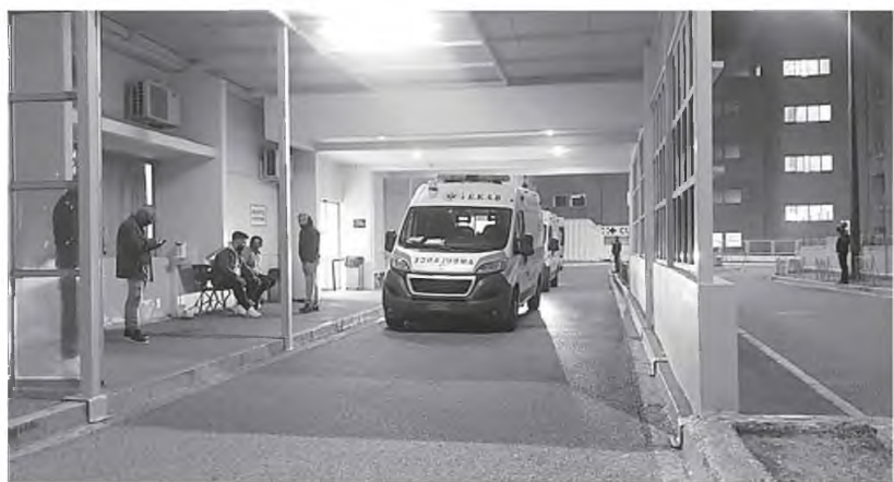
Περιστατικά φθάνουν κάθε τρεις και λίγο. Ακόμη και δύο ασθενοφόρα φέρνουν «κόσμο» στα επείγοντα του Νοσοκομείου Ρίου

μέρι της Παρασκευής. Φθάσαμε εκτάκτως εδώ και μας έβαλαν στα επείγοντα εξωτερικά ιατρεία. Από εκείνη την ημέρα μέχρι και το μεσημέρι της Δευτέρας είμαστε εδώ. Δεν έχουμε φύγει από το ράντζο, δεν υπάρχει κρεβάτι σε κανέναν θάλαμο και σε καμία κλινική. Όλα είναι covid. Οι γιατροί και οι νοσηλεύτριες των εξωτερικών ιατρείων κάνουν τα πάντα. Υπερβαίνουν και τους εαυτούς τους. Δεν είναι ότι αδιαφορούν ή σιδήπυτε άλλο. Οντως δεν υπάρχει ούτε ένα διαθέσιμο κρεβάτι στο νοσοκομείο» έγραφε στο facebook το Σάββατο 13 Νοεμβρίου ο συνδι-