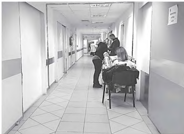
Όλα τα σημεία πολιορκούνται