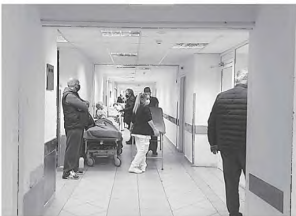
Σώμα με σώμα η αναμέτρηση