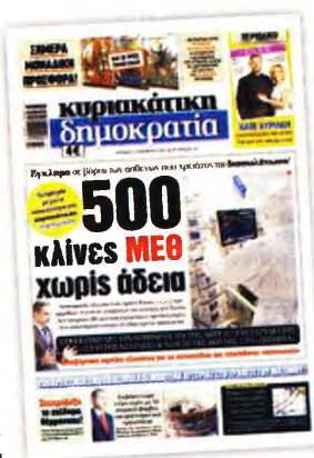
Το χθεσινό αποκαλυπτικό πρωτοσέλιδο της «κυριακάτικης δημοκρατίας»