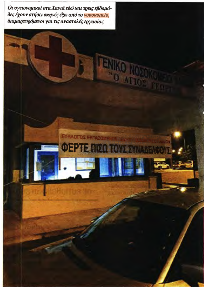
Οι υγειονομικοί στα Χανιά εδώ και τρεις εβδομάδες έχουν στήσει σκηνές έξω από το νοσοκομείο , διαμαρτυρούμενοι για τις αναστολές εργασίας

Είναι αυτοί που επέλεξαν το «όχι» στην υποχρεωτικότητα μιας προληπτικής ιατρικής πράξης, που παραπέμπει στις πλέον «σκοτεινές» σελίδες της Ιστορίας. Επέλεξαν το «όχι» στην εργαλειοποίηση της πανδημίας, στην περιστολή των δικαιωμάτων αλλά και στον καθ' εξακολούθηση εμπαιγμό. Αυτούσιος εμπαιγμός και διά στόματος του υπουργού Επικρατείας Α. Σκέρτσου, καθώς -όπως μάθαμε- «δεν υπάρχουν μελέτες ότι οι ένστολοι μεταδίδουν τον ιό» και επειδή «λαμβάνουν ειδική εκπαίδευση, αν τεθούν σε αναστολή, δεν αναπληρώνονται εύκολα», υπογραμμίζοντας με αυτόν τον τρόπο ακόμη μία φορά την απόλυτη περιφρόνηση της κυβέρνησης για τους κατοίκους αυτής της χώρας.