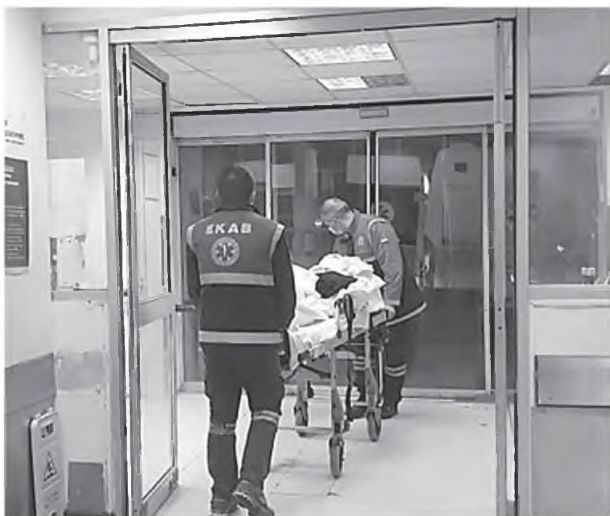
Γιατροί και νοσηλεύτές κάνουν ό,τι μπορούν

Περάσαμε κάμποση ώρα στα εξωτερικά ιατρεία του ΠΓΝΠ. Στο υοσοκομείο «όλα είναι κόβιντ». Ο υπόλοιπος κόσμος