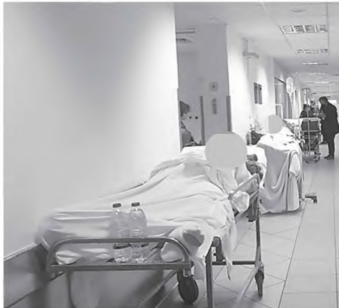
Η μητέρα του κ. Δημήτρη στον διάδρομο. Κάνει υπομονή