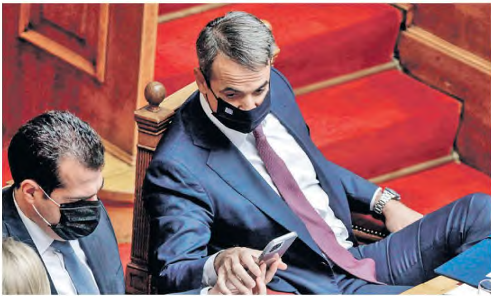
Η πρωτοφανής ανικανότητα του κ. Μητσοτάκη και των υπουργών του μας οδηγούν νομοτελειακά σε εκατόμβη νεκρών και lockdown, επιστομάνει η αξιωματική αντιπολίτευση στηλιτεύοντας το γεγονός ότι οι ιδιωτικές κλινικές παραμένουν έξω από τη μάχη