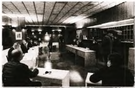
προβλήματα, να ανοίξουμε έναν δρόμο να πάμε μπροστά». Στη συνάντηση, ο πρόεδρος και τα μέλη του ΔΣ της ΠΟΕΔΗΝ ε-

Σας καλωσορίζω, λοιπόν, ευχόμενος καλή δύναμη, καλή υγεία και καλούς αγώνες, γιατί μόνο με τον αγώνα μπορούμε να επιλύσουμε