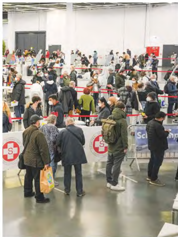
Η Κομισιόν επιχειρεί να θέσει κοινό πλαίσιο στο εσωτερικό της Ε.Ε., αποτρέποντας έναν κατακερματισμό που θα έπληττε την ελεύθερη κυκλοφορία και την απρόσκοπτη λειτουργία της ενιαίας αγοράς.

Παράλληλα, η Επιτροπή προτείνει από τις 10 Ιανουαρίου του 2022 τα κράτη-μέλη να ανοίξουν τα σύνορά τους σε ταξιδιώτες από τρίτες χώρες που είναι εμβολιασμένοι με κάποιο από τα εμβόλια τα οποία έχει εγκρίνει ο Παγκόσμιος Οργανισμός Υγείας. Ωστόσο, αν πρόκειται για εμβόλια εγκεκριμένα από τον ΠΟΥ, αλλά όχι από τον