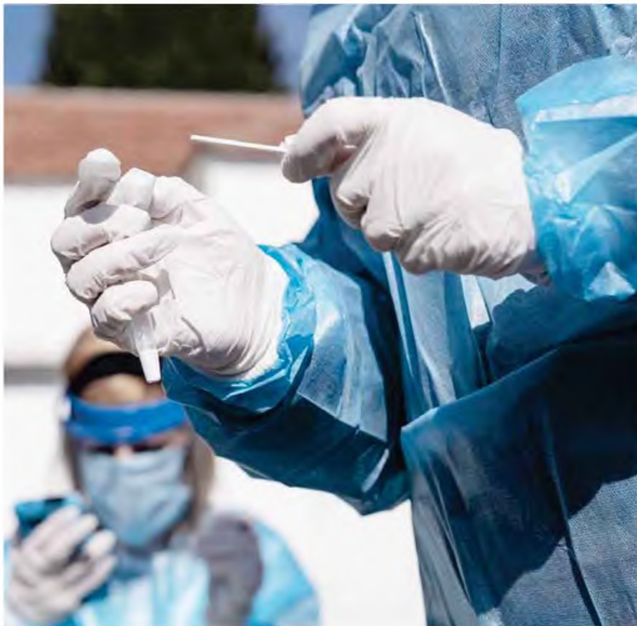
Από το σύνολο των 4.943 νέων κρουσμάτων του νέου ιού στη χώρα, 11 είναι εισαγόμενα, εκ των οποίων 7 εντοπίστηκαν κατόντι ελέγχων στις πύλες εισόδου της χώρας.

Σύμφωνα με την κ. Θεοδωρίδου πρόκειται για ερωτήματα, οι απαντήσεις των οποίων απαιτούν χρόνο για να δοθούν.