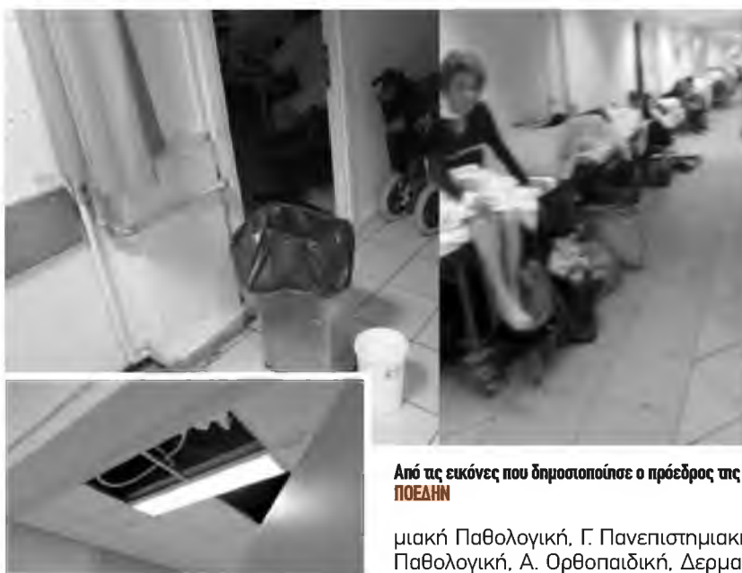
Από τις εικόνες που δημοσιοποίησε ο πρόεδρος της ΠΟΕΔΗΝ

Για εικόνες ντροπής έκανε λόγο χθες ο πρόεδρος της ΠΟΕΔΗΝ, Μιχάλης Γιαννάκος, περιγράφοντας τα όσα βιώνουν οι ασθενείς στο Πανεπιστημιακό Νοσοκομείο του Ρίου. Όπως φαίνεται σε φωτογραφίες που δημοσιοποίησε ο πρόεδρος της ΠΟΕΔΗΝ Μιχάλης Γιαννάκος, οι διάδρομοι σε ένα από τα μεγαλύτερα και πιο οργανωμένα νοσοκομεία της χώρας έχουν γεμίσει με ασθενείς σε ράντζα. Σύμφωνα με τον ίδιο, συνολικά επτά κλινικές έχουν μετατραπεί σε κλινικές κορωνοϊού. Μεταξύ αυτών η Οφθαλμολογική, η Α' Παιδιατρική, η Α' Ορθοπαιδική και άλλες. «Το Υπουργείο Υγείας είπε ότι δεν θα καταστήσουμε τα νοσοκομεία μονοθεματικά. Υπάρχουν και τα γενικά περιστατικά. Αυτοδιαψεύστηκαν. Έκοψαν τα χειρουργεία. Συνεχώς μετατρέπουν γενικές κλινικές σε κλινικές κορωνοϊού. Πολλά περιστατικά άλλων παθήσεων