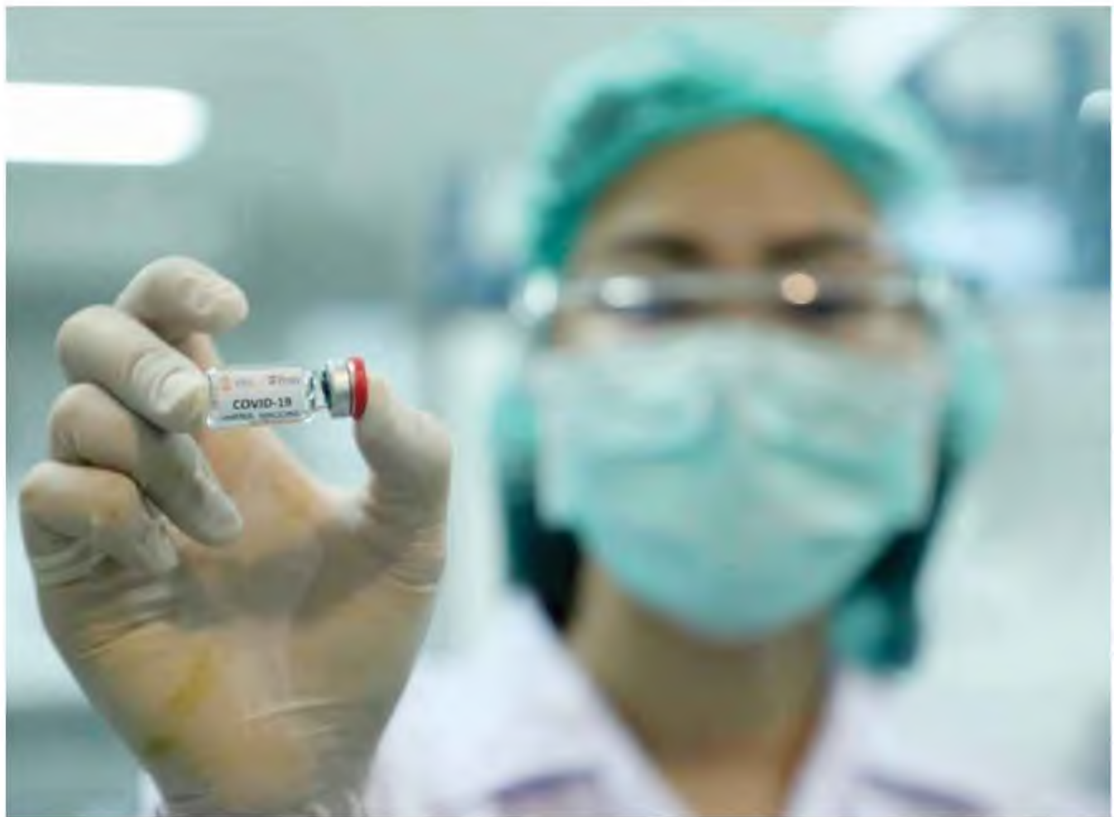
Στα σκαριά είναι ο υποχρεωτικός εμβολιασμός για τους 50άρηδες, ενώ ήδη η ηλικιακή ομάδα 75-79 ετών έσπασε το φράγμα των κατά 90% εμβολιασμένων Ελλήνων.

■ 714 οι διασωληνωμένοι στις ΜΕΘ, από τους οποίους οι 571 είναι ανεμβολίαστοι ή μερικώς εμβολιασμένοι - Το τρίτο χειρότερο ρεκόρ από την αρχή της πανδημίας