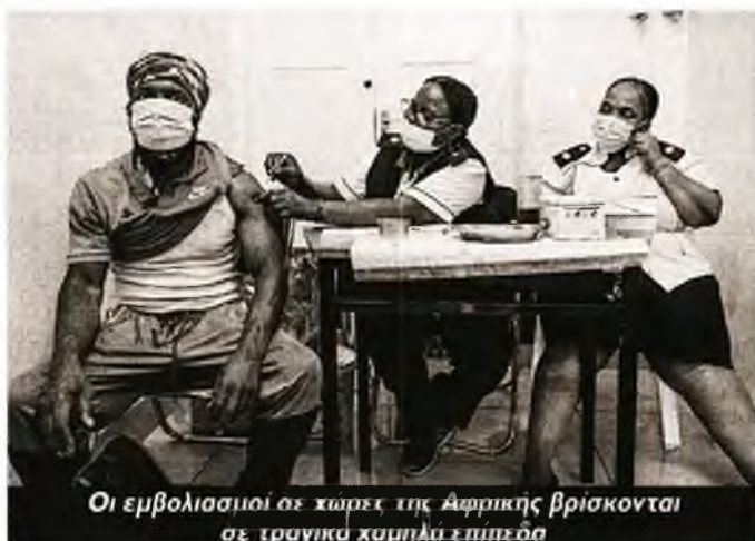
Οι εμβολιασμοί σε χώρες της Αφρικής βρίσκονται σε τρυγικά χαμηλά επίπεδα

Συγκεκριμένα, σε έκθεσή του το ίδρυμα «Mo Ibrahim» αναφέρει ότι η Αφρική δεν θα καταφέρει να ξεπεράσει την πανδημία αν δεν εμβολιαστεί το 70% του πληθυσμού της έως το τέλος του 2022. Αυτήν τη στιγμή όμως, όπως επισημαίνει, ο εμβολιασμός στις αφρικανικές χώρες είναι μόλις γύρω στο 6% του πληθυσμού, ενώ μόνο 5 από τις 54 αφρικανικές χώρες βρίσκονται σε καλό δρόμο για να πετύχουν τον στόχο του Παγκόσμιου Οργανισμού Υγείας να εμβολιάσουν πλήρως κατά της COVID-19 το 40% του πληθυσμού τους μέχρι το