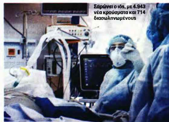
Σαρώνει ο ιός, με 4.943 νέα κρούσματα και 714 διασωληνωμένους

Ανησυχία προκαλεί στους ειδικούς και η υπερ-μεταδοτική μετάλλαξη Όμικρον που έχει κάνει την εμφάνισή της, καθώς τα δύο ύποπτα κρούσματα των Ελλήνων ταξιδιωτών που έφτασαν το περασμένο Σάββατο στην Αθήνα, από τη Νότια Αφρική, αποδείχθηκαν και αυτά θετικά στην παραλλαγή. Υπενθυμίζεται ότι το πρώτο κρούσμα ήταν ένας επιχειρηματίας της Κρήτης, ο οποίος δραστηριοποιείται επιχειρηματικά στο Γιοχάνεσμπουργκ και είχε έρθει για να περάσει στο πατρικό του τις γιορτές των Χριστουγέννων.