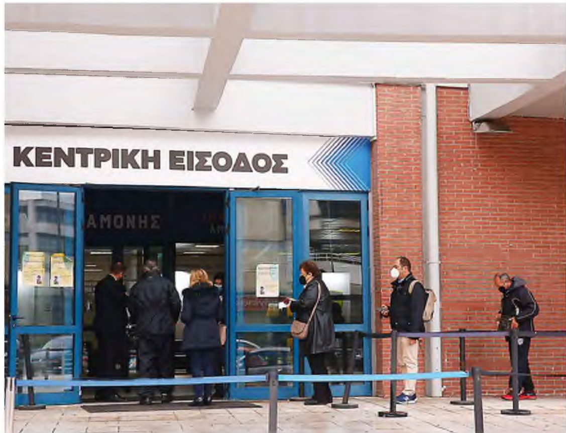
Ουρά στο εμβολιαστικό κέντρο «Προμηθέας» στο Μαρούσι. Σύμφωνα με πρόσφατη έρευνα, που παρουσιάστηκε χθες, μόλις ένα 8% δηλώνει ότι δεν σκοπεύει να λάβει την τρίτη δόση του εμβολίου, είτε γιατί δεν θεωρεί ότι είναι απαραίτητο είτε επειδή φοβάται για ενδεχόμενες παρενέργειες.

Όπως κατέδειξε η έρευνα, το 74% του ενήλικου πληθυσμού έχει εμβολιαστεί για την COVID-19, το 43% για τη γρίπη, το 25% για τον πνευμονόκοκκο, το 14% για την ηπατίτιδα Β, το 11% για τον έρπητα ζωστήρα, το 10% έχει κάνει το τρίδυμο εμβόλιο διφθερίτιδας, τετάνου, κοκκύτη, και το 6% το τετραδύναμο διφθερίτιδας, τετάνου, κοκκύτη, πολιομυελίτιδας. Από όσους δεν έχουν εμβολιαστεί για πνευμονόκοκκο ή γρίπη, το 56% δεν το θεωρεί απαραίτητο, το 24% είναι επιφυλακτικό με τα εμβόλια και το 20% δηλώνει αμέλεια. Το 18% των συμμετεχόντων ανέφερε ότι έχει επηρεαστεί από την πανδημία του κορωνοϊού στην απόφαση