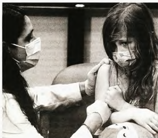
Κοριτσάκι εμβολιάζεται για την Covid-19 στην πόλη Στορς του Κονέκτικατ, στις ΗΠΑ

πιθανό να συμβεί με την Covid-19 μέσα στο 2022. Είναι αλήθεια ότι θα υπάρχουν τοπικές και εποχικές εξάρσεις, ειδικά σε χώρες με χαμηλά ποσοστά εμβολιασμού. Οι επιδημιολόγοι θα πρέπει να προσέχουν διαρκώς για νέες παραλλαγές που μπορεί να είναι ικανές να ξεπεράσουν την ανοσία την οποία παρέχουν τα εμβόλια. Πάντως, χθες, ο δήμαρχος της Νέας Υόρκης Μπιλ ντε Μπλάζιο ανακοίνωσε ότι όλοι οι εργαζόμενοι στον ιδιωτικό τομέα θα πρέπει να εμβολιαστούν κατά του κορωνοϊού, αρχής γενομένης από την 27η Δεκεμβρίου. Ο υποχρεωτικός εμβολιασμός αφορά όλους τους «εργαζόμενους του ιδιωτικού τομέα στη Νέα Υόρκη», δηλαδή σχεδόν 184.000 επιχειρήσεις, εταιρείες και εμπορικά καταστήματα.