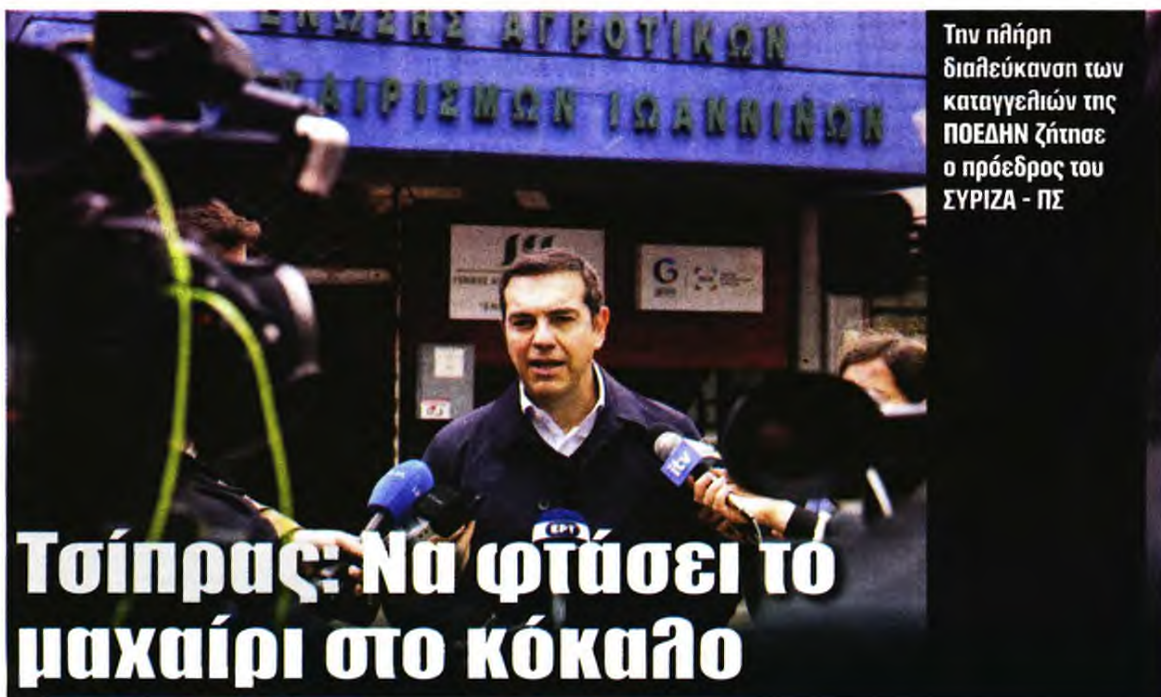
Την πλήρη διαλεύκανση των καταγγελιών της ΠΟΕΔΗΝ ζήτησε ο πρόεδρος του ΣΥΡΙΖΑ - ΠΣ

«Όλοι είμαστε ίσοι απέναντι στο δικαίωμα για ζωή, απέναντι στο δικαίωμα για αξιοπρεπή περίθαλψη. Φτάσαμε ως εδώ, διότι η κυβέρνηση Μητσοτάκη υποτίμησε το δικαίωμα στην αξιοπρεπή περίθαλψη και τη ζωή και δεν έχει κάνει τίποτα πραγματικά, για να ενισχύσει το Εθνικό Σύστημα Υγείας και την Πρωτοβάθμια περίθαλψη, τίποτα σε σχέση με τις αυξημένες ανάγκες για μία περίοδο πανδημίας. Και αυτή είναι αποκλειστική ευθύνη της κυβέρνησης».