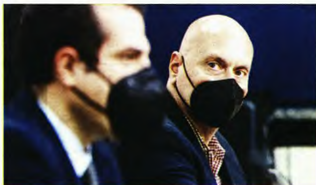
Ο υπουργός Υγείας Θ. Πλεύρης με τον πρόεδρο του ΕΟΔΥ Θεοκλή Ζαούτη