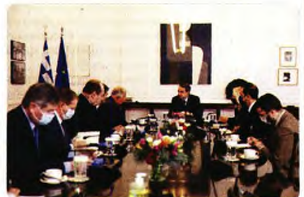
1:43 μ.μ. · 9 Δεκ 2021 · Twitter Web App