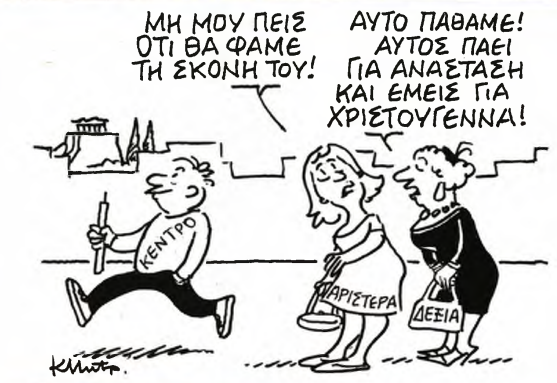
ΤΟΥ ΚΩΣΤΑ ΜΗΤΡΟΠΟΥΛΟΥ

Εκείνο που έμαθα είναι ότι το 2014 η ελληνική κυβέρνηση έφτασε πολύ κοντά με τη ρωσική για την παράδοση του αρχείου των Εβραίων της Θεσσαλονίκης. Μάλιστα, η Αθήνα ήταν πρόθυμη να πληρώσει και τα «φύλακτα» των αρχείων (που δεν είναι περισσότερο από 80.000 ευρώ). Και επίσης δέχθηκε χωρίς απαιτήσεις ή ανταλλάγματα να παραδώσει στη Μόσχα και τα αρχεία του ρωσικού προξενείου στα Χανιά και τον πίνακα της Ρωσικής Προτοπορίας. Οι Ρώσοι ωστόσο το καθύστεροσαν. Μετά ήρθαν οι απελάσεις των ρώσων διπλωματών και εκεί που η υπόθεση χανάταν, ο