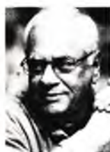
Του ΘΑΝΑΣΗ ΚΑΡΤΕΡΟΥ

Δ εν τους νοιάζει! Αυτό το σόου, ο κυνισμός, η αδιαφορία, η παγωνιά, και τελικά η απανθρωπιά που βγάζει σε συνθήκες κοινωνικού δράματος η κυβέρνηση, με πρώτο τον Μητσοτάκη, είναι ίσως το χειρότερο απ' όλα. Το πιο εξοργιστικό για κάποιους, αλλά και το πιο παραλυτικό για κάποιους άλλους, που βλέπουν ότι ο κόσμος καίγεται - κυριολεκτικά το τελευταίο καλοκαίρι-, ο κόσμος πεθαίνει -κυριολεκτικά κάθε μέρα-, ο κόσμος παγώνει, ξεσπιτώνεται και πεινάει -κυριολεκτικά με την εκτίναξη των τιμών-, αλλά αυτοί που έχουν την ευθύνη συνεχίζουν τον χαβά τους. Όλα πάνε μια χαρά!