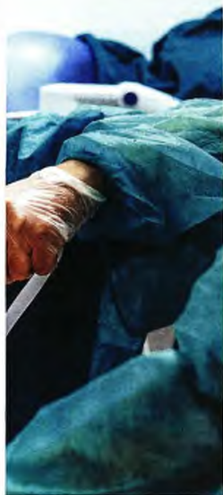
Μέλη του ιατρικού προσωπικού της ΜΕΘ του νοσοκομείου Σωτηρία περιποιούνται ασθενή με COVID (φωτογραφία αρχείου)