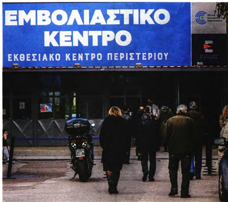
Πολίτες προσέρχονται στο εμβολιαστικό κέντρο Περιστερίου. Παρότι αρκετοί στην Ελλάδα κλείνουν ακόμη ραντεβού για την πρώτη δόση, η συζήτηση έχει φτάσει ήδη στο τέταρτο «τοίμημα»!