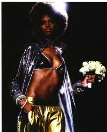
Η σωτήρια εφ. Αφρικής Ομικρον μας φέρνει και ανθοδέσμη « αφίκα να μην κρύβεται» δηλητηριώδες φιδάκι εκεί μέσα