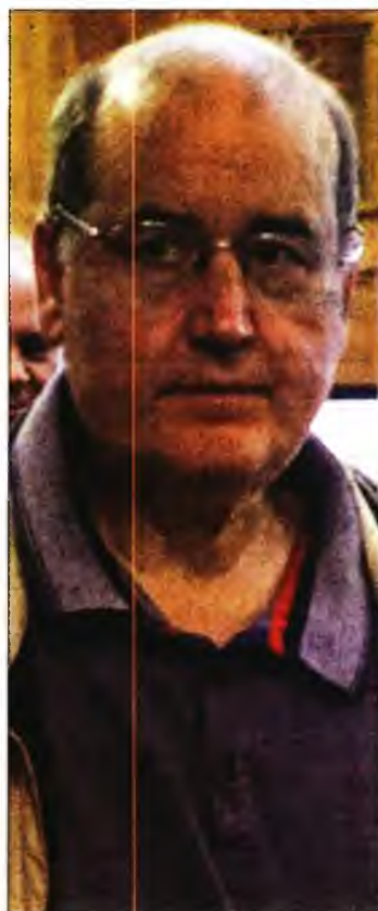
Ο Νίκος Φίλης

Η στάση των δύο βουλευτών προκαλεί σοβαρό εσωκομματικό πρόβλημα και μάλιστα τη στιγμή που ακόμα και ο κυβερνητικός εκπρόσωπος Γιάννης Οικονόμου, σε αντίθεση με τον υπουργό Υγείας, αναγνώριζε ότι οι ηχηρές καταγγελίες των ιατρικών Ενώσεων πρέπει να διερευνηθούν. Την περασμέ-