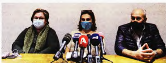
Από τη συνέντευξη που έδωσε το προεδρείο της Ελληνικής Εταιρείας Εντατικής Θεραπείας την περασμένη Παρασκευή

Η έλλειψη κλινών ΜΕΘ και προσωπικού, που δημιουργούν