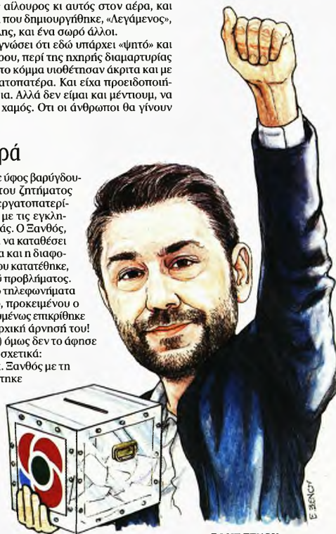
ΤΗΣ ΕΦΗΣ ΞΕΝΟΥ