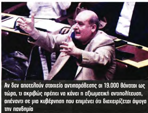
Αν δεν αποτελούν στοιχείο αντιπαράθεσης οι 19.000 θάνατοι ως τώρα, τι ακριβώς πρέπει να κάνει η αξιωματική αντιπολίτευση, απέναντι σε μια κυβέρνηση που επιμένει ότι διαχειρίζεται άψογα την πανδημία