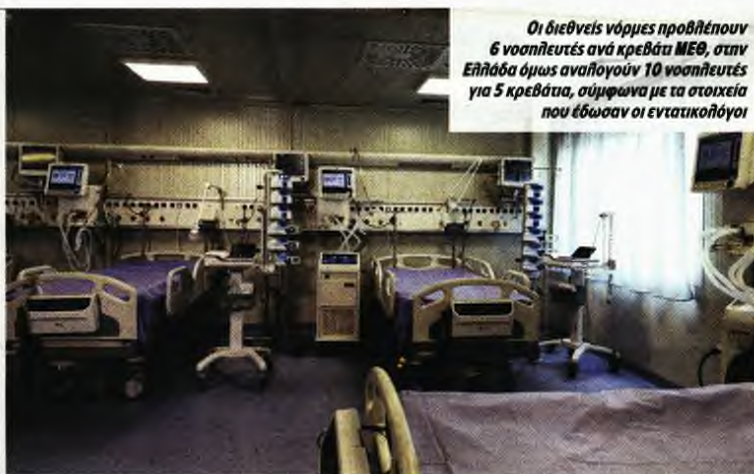
Οι διεθνείς νόρμες προβλέπουν 6 νοσηλευτές ανά κρεβάτι ΜΕΘ, στην Ελλάδα όμως αναλογούν 10 νοσηλευτές για 5 κρεβάτια, σύμφωνα με τα στοιχεία που έδωσαν οι εντατικολόγοι

Απαντήσεις από τα πιο υπεύθυνα χείλη στις αναφορές του Κυρ. Μπυστάκη για την ποιότητα νοσηλείας των διασωληνωμένων εκτός ΜΕΘ: Για τον υψηλό αριθμό θανάτων φταίνει οι ελλείψεις σε κρεβάτια εντατικής και προσωπικό ● Χαρακτηρίζουν ανυπόστατους τους ισχυρισμούς για διακρίσεις μεταξύ ασθενών