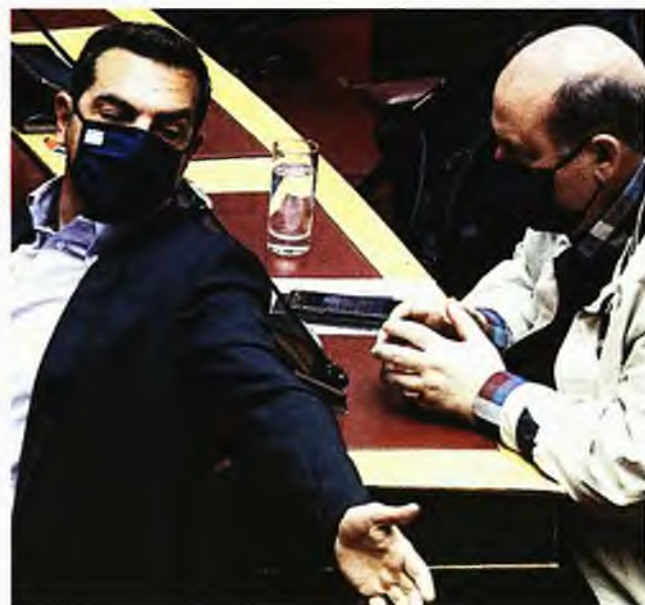
Ο Αλέξης Τσίπρας συνομιλεί με τον Νίκο Φίλη στη Βουλή

Σύμφωνα με μια ανάγνωση όλα αυτά είναι η μύτη του παγόβουνου. Και το δεύτερο είναι ένα βαθύ χάσμα για τον τρόπο που πρέπει να ασκείται η αντιπολίτευση.