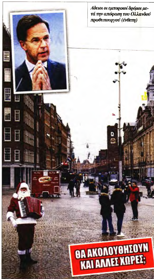
Άδειοι οι εμπορικοί δρόμοι μετά την απόφαση του Ολλανδού πρωθυπουργού (ένθεση)

δωλαδιά τη Δευτέρα, και θα παραμείνουν κλειστά τουλάχιστον έως τις 9 Ιανουαρίου. Παρόλλαπα, τα νοικοκυριά καλούνται να μη δέχονται πάνω από δύο επισκέπτες, ενώ οι συγκεντρώσεις σε εξωτερικούς χώρους είναι επίσης περιορισμένες στα δύο άτομα.