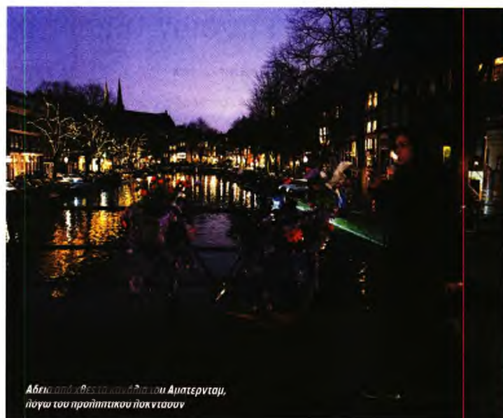
Άδεια από χθες το πρωί στην Αμστερνταμ, λόγω του προληπτικού πικνιτσίου