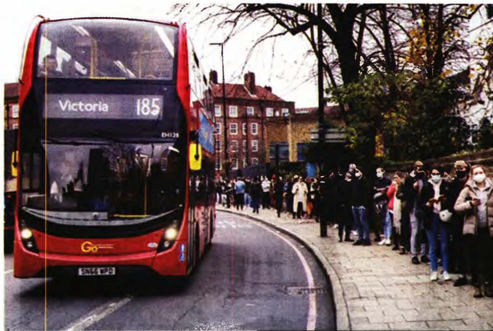
Γενικό lockdown δύο εβδομάδων αμέσως μετά την ημέρα των Χριστουγέννων στο Ην. Βασίλειο

Παράλληλα, υπάρχουν ακόμη περιορισμένα διαθέσιμα δεδομένα και δεν υπάρχουν στοιχεία που να έχουν αξιολογηθεί από ειδικούς σχετικά με την αποτελεσματικότητα ή την αντοχή του εμβολίου μέχρι σήμερα. Ο ΠΟΥ προειδοποιεί ότι με τα κρούσματα να αυξάνονται με τέτοια ταχύτητα, τα νοσοκομεία θα δεχθούν και πάλι μεγάλη πίεση σε κάποιες περιοχές. Ήδη οι νοσηλείες σε Ηνωμένο Βασίλειο και Νότια Αφρική συνεχί-