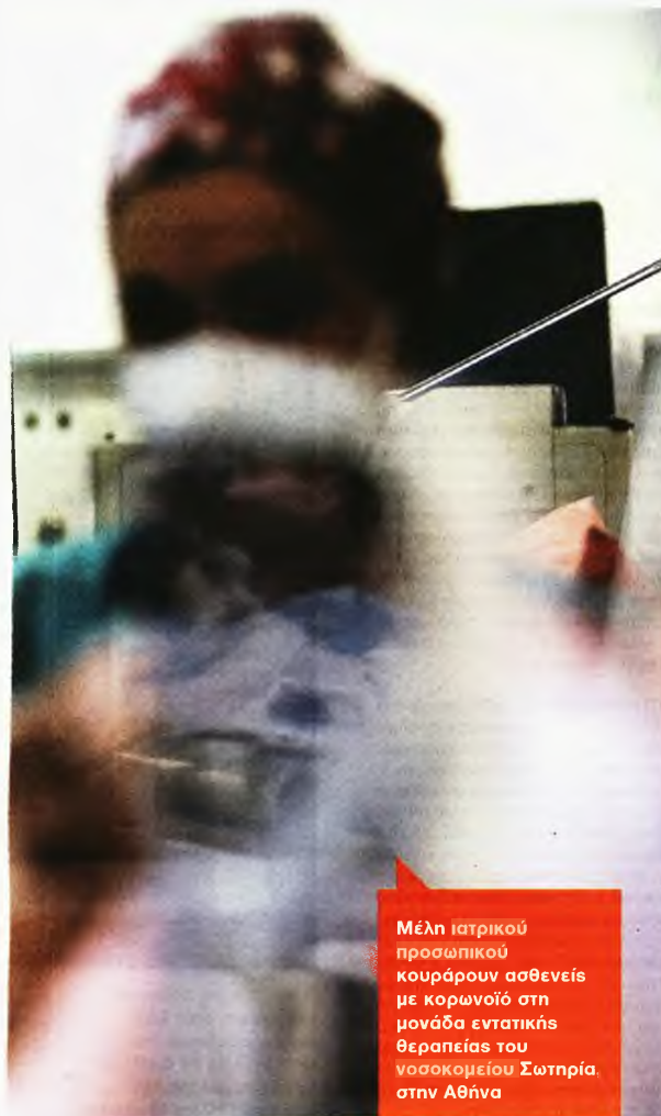
Μέλη ιατρικού προσωπικού κουράρουν ασθενείς με κορωνοϊό στη μονάδα εντατικής θεραπείας του νοσοκομείου Σωτηρία, στην Αθήνα

υποχρεωτικότητα το 50%-60% ώστε να περιοριστεί ο συγχρωτισμός σε ΜΜΜ και η ταυτόχρονη παρουσία σε εργασιακούς χώρους. Παράλληλα, συζητείται η επέκταση της υποχρεωτικότητας του εμβολιασμού στην ηλικιακή ομάδα 50-59 ετών ώστε να αντιμετωπιστεί η διαφαινόμενη πίεση στο ΕΣΥ που αναμένεται να φέρει το επόμενο διάστημα η μετάλλαξη Ομικρον. Για τη λειτουργία του λιανεμπορίου, ενώ προς το παρόν δεν είναι από τις βασικές εστίες προβληματισμού, δεν αποκλείεται ανάλογα με τα επιδημιολογικά δεδομένα να υπάρξει κι εκεί κάποια παρέμβαση όσον αφορά τη μείωση του αριθμού πελατών με βάση τη χωρητικότητα των καταστημάτων.