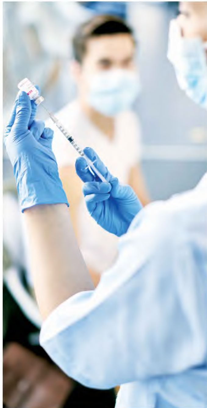
Τον Νοέμβριο στην Ελλάδα ξεκίνησε η χορήγηση της 3ης δόσης σε όλους.