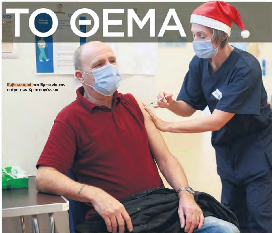
Εμβολιασμοί στη Βρετανία την ημέρα των Χριστουγέννων.