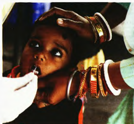
Μέλος ιατρικού προσωπικού παίρνει δείγμα από ένα παιδάκι κατά τη διάρκεια εξέτασης για Covid-19 στο Νέο Δελχί της Ινδίας. Η χώρα μετρά επίσημως σχεδόν 480.000 θανάτους από τον κορωνοϊό

ΣΤΗΝ ΙΤΑΛΙΑ, από την άλλη, την ίδια ημέρα ανακοινώθηκαν 54.774 νέα κρούσματα και 144 θάνατοι – ενώ χθες υπήρξε μία κάμψη, με περίπου τα μισά κρούσματα και 81 θανάτους. Ωστόσο, το ενθαρρυντικό είναι ότι, αφενός, ο ρυθμός εμβολιασμού συνεχίζει να είναι υψηλός και, αφετέρου, σε σύγκριση με την ίδια περίοδο πέρυσι οι νοσηλευόμενοι στις ΜΕΘ είναι περίπου οι μισοί (1.071). Σε υψηλά επίπεδα, πάνω από 60.000 ημερησίως, κινούνται τα νέα κρούσματα και στην Ισπανία, ενώ στη Γερμανία, όπου η κατάσταση εμφανίζεται να είναι σαφώς καλύτερη, χθες ανακοινώθηκαν 10.100 νέα κρούσματα και 88 νεκροί από την Covid-19.