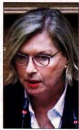
Η Μίνα Γκάγκα

Ακόμα μία φορά η κυβέρνηση σκέφτηκε την επικοινωνιακή διαχείριση της πανδημίας και επιχείρησε να συγκαλύψει το γεγονός ότι παρέλαβε μόλις 2.000 δόσεις μονοκλωνικών αντισωμάτων, θεωπίζοντας ιδιαίτερα αυστηρούς όρους και προϋποθέσεις για τη χορήγηση τους. Το αποτέλεσμα ήταν ασθενείς που θα έπρεπε να δεχθούν τη συγκεκριμένα σκευάσματα να μην μπορούσαν να τα λάβουν, με αποτέλεσμα η ζωή τους να τίθεται σε κίνδυνο. Το ανελέητο σφυροκόπημα της αντιπολίτευσης, η κραυγή αγανάκτησης των γιατρών, αλλά και η οργή των οικογενειών των νοσηλευόμενων οδήγησαν την κυβέρνηση σε άτακτη υποχώρηση και την αναπλήρωση υπουργού Υγείας σε μια ανακοίνωση, ταπεινωτική για την ίδια ως γιατρό.