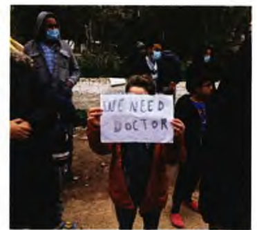
ΑΡΙΣΤΕΡΑ: Κινητοποίηση εργαζομένων και προσφύγων στα Διαβατά ΔΕΞΙΑ: Ουσιαστική υγειονομική περιθαλψη και γιατρούς ζητούν οι πρόσφυγες