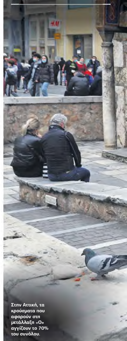
Στην Αττική, τα κρούσματα που αφορούν στη μετάλλαξη «Ο» αγγίζουν το 70% του συνόλου.