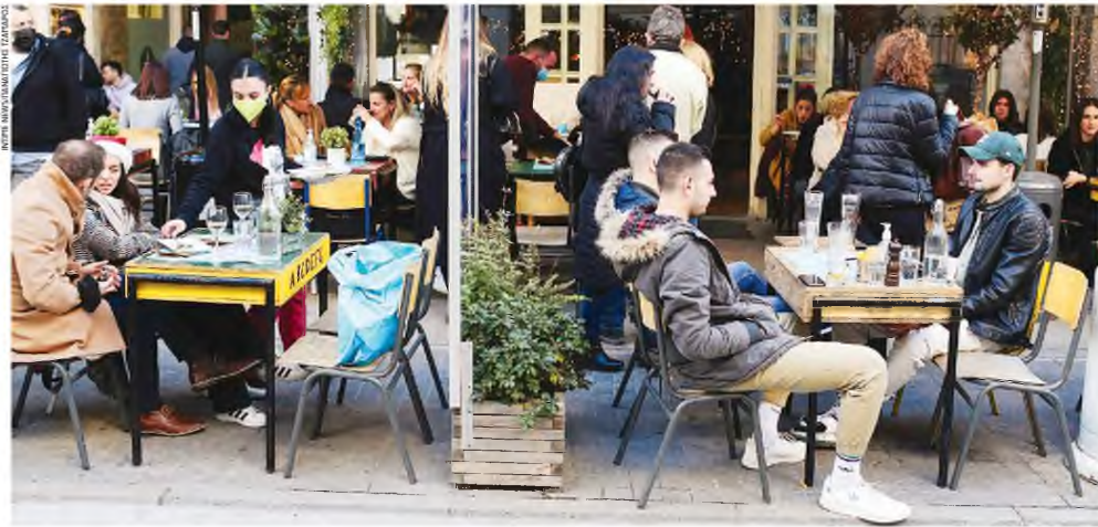
Το ρεκόρ κρουσμάτων φέρνει επίσπευση των μέτρων, που μεταξύ άλλων αφορούν το ωράριο και τις αποστάσεις στην εστίαση.

Απλάδι, όπως φαίνεται, επισπεύδεται η υποχρεωτική χρήση μάσκας υψηλής προστασίας ή διπλής μάσκας στα σουπερμάρκετ, στα ΜΜΜ και στο προσωπικό των χώρων εστίασης, λειτουργία μέχρι τις 12 τα μεσάνυχτα στη διασκέδαση και την εστίαση, χωρίς όρθιους και με 6 άτομα/τραπέζι και φυσικά με αποστάσεις, αγώνες με συμμετοχή 10% στα γήπεδα και με ανώτατο όριο τα 1.000 άτομα, επίσκεψη στις Μονάδες Φροντίδας Ηλικιωμένων και Χρονίως Πασχόντων με PCR test 48 ωρών και τηλεργασία έως 50% σε δημόσια και ιδιωτικά τομεία άμεσα. Επίσης, ανοικτό είναι το ενδε-