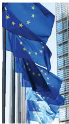
Αρκετοί ειδικοί τονίζουν ότι η Ε.Ε. θα μπορούσε έστω και τώρα να εγκρίνει κοινά μέτρα κατά της Όμικρον.

«Αρκετές κυβερνήσεις αντιμετωπίζουν ένα εφιαλτικό δίλημμα: Να επιβάλουν περιορισμούς σε ένα ήδη κουρασμένο κοινό από τα συνεχή μέτρα ή να διακινδυνεύουν τη συντριβή των συστημάτων υγείας», είναι το ερώτημα που θέτει η ευρωπαϊκή ιστοσελίδα Politico. Αλλά απουσιάει παντελώς μια εντι-