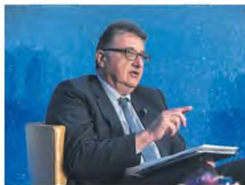
ΓΙΑ ΤΗΝ ΚΑΡΑΝΤΙΝΑ

σκεψη στο Μέγαρο Μαξίμου με τον πρωθυπουργό Κυριάκο Μητσοτάκη, τον καθηγητή Σωτήρη Τσιόδρα και τον υπουργό Υγείας Θάνο Πλεύρη. Στη συνέχεια, στις 12 το μεσημέρι, επρόκειτο να συνεδριάσει η επιτροπή των ειδικών, με τη νέα εισήγηση για την πιθανή επεξευμένη εφαρμογή των μέτρων. Στις δηλώσεις τους, τόσο ο κ. Πλεύρης όσο