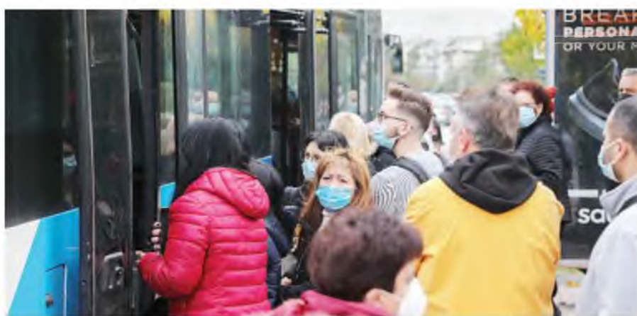
Μάχη εντυπώσεων μεταξύ της κυβέρνησης και των κομμάτων της αντιπολίτευσης για τον τρόπο διαχείρισης της πανδημίας.

Ο αρχηγός της αξιωματικής αντιπολίτευσης Αλέξης Τσίπρας με ανάρτησή του σημείωσε ότι από την περασμένη Τετάρτη είχε ενημερωθεί από τους επιστήμονες για την αναμενόμενη εξέλιξη των κρουσμάτων την εβδομάδα των εορτών, με αποτέλεσμα να ζητήσει την άμεση εφαρμογή μέτρων. «Αναρωτιέ-