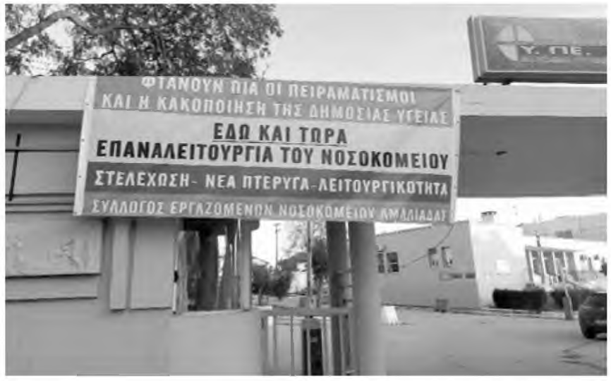
Πάνο στην είσοδο της νοσηλευτικής μονάδας Αμαλιάδας, ανάρτησαν οι εργαζόμενοι επικρίνοντας τους κυβερνητικούς χειρισμούς για την Δημόσια Υγεία και διεκδικώντας ισχυρό ρόλο για το Νοσοκομείο την επόμενη περίοδο.

-Σχεδιάζουν «οικονομικότερο» μοντέλο δημόσιας περίθαλψης με είσοδο ιδιωτών