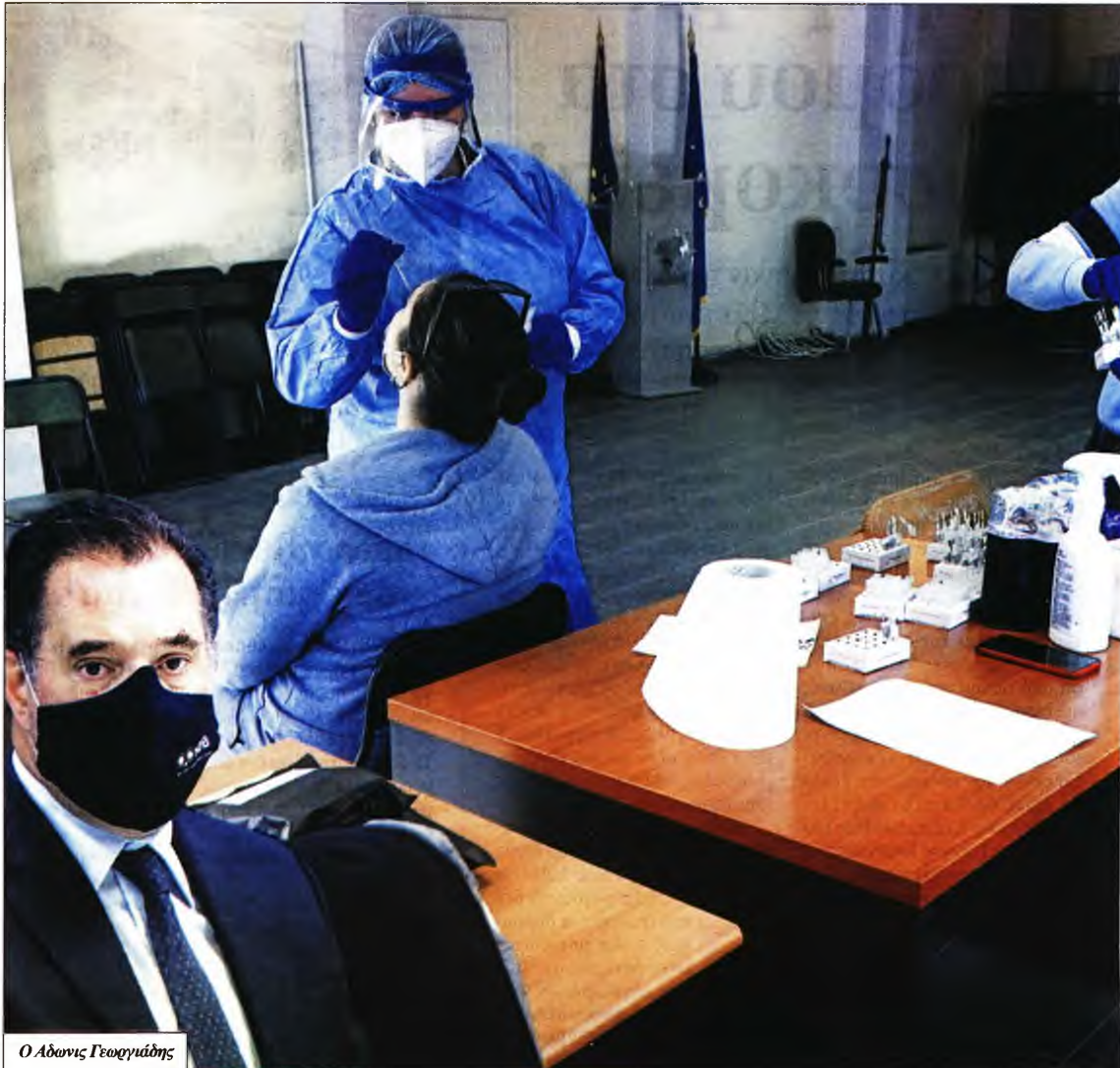
Ο Αδωνις Γεωργιάδης

ΔΕΝ ΛΕΕΙ να τελειώσει ο διασυρμός του Αδωνη Γεωργιάδη στο ζήτημα των μοριακών ελέγχων και στο γεγονός πως επί δύο χρόνια έκανε τα στραβά μάτια στην αισχροκέρδεια σε βάρος των πολιτών.