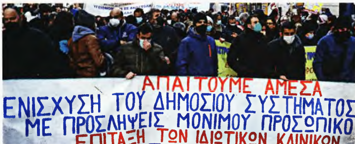
ΒΑΣΙΛΟΣ ΓΙΩΤΣ ΜΑΡΙΟΣ

Περισσότεροι από 5.000 είναι οι νοσηλευόμενοι ασθενείς με κορονοϊό πανελλαδικά, ενώ την τελευταία εβδομάδα καταγράφεται ιλιγγιώδης αύξηση 40% στις νοσηλείες. Αύξηση στις νέες νοσηλείες παρατηρείται έντονα στην περιφέρεια