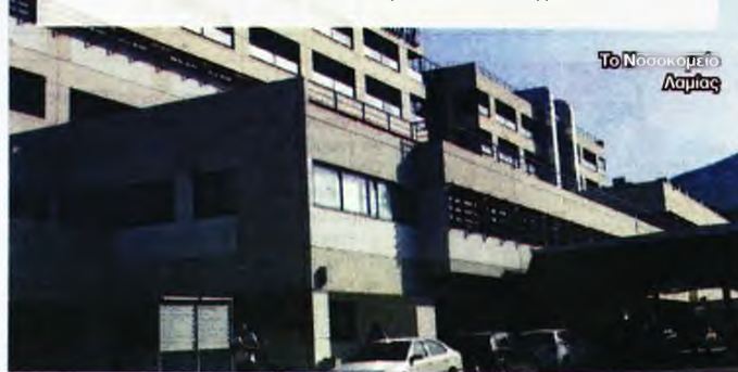
Το Νοσοκομείο Λαμίας

Ανάλογη είναι η κατάσταση και στα δύο μεγάλα νοσοκομεία των Ιωαννίνων, το «Χατζηκώστα» και το Πανεπιστημιακό Νοσοκομείο. Η εβδομάδα άρχισε με 16 ασθενείς στις Μονάδες Εντατικής Θεραπείας και 67 ασθενείς στις Κλινικές Covid, ενώ έλασε τη μάχη ένας 67χρονος από το Μέτσοβο, ο οποίος νίκηθηκε από τον ιό, αν και είχε κάνει τις πρώτες δύο δόσεις του εμβολίου.