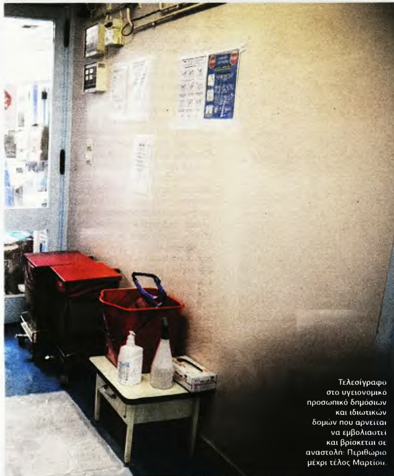
Τελεσίγραφο στο υγειονομικό προσωπικό δημοσίων και ιδιωτικών δομών που αρνείται να εμβολιαστεί και βρίσκεται σε αναστολή: Περιθώριο μέχρι τέλος Μαρτίου.