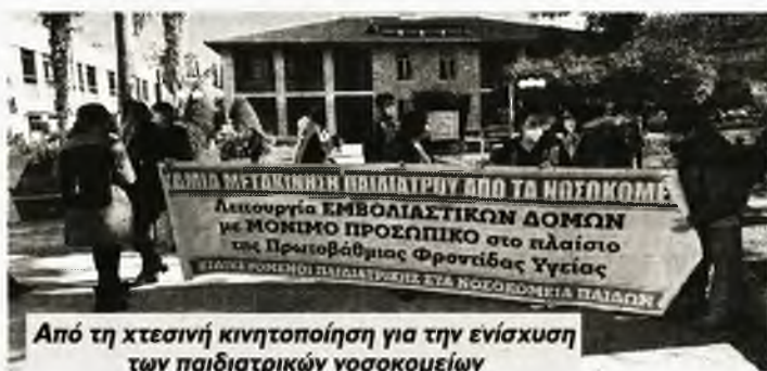
Από τη χτεσινή κινητοποίηση για την ενίσχυση των παιδιατρικών νοσοκομείων

Οι εργαζόμενοι στο δημόσιο σύστημα Υγείας απ' άκρη σ' άκρη της χώρας διεκδικούν: ● Μαζικές προσλήψεις μόνιμου προσωπικού. Μονιμοποίηση όλων των συμβασιούχων, χωρίς