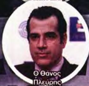
Ο Θάνας Πλεύρης