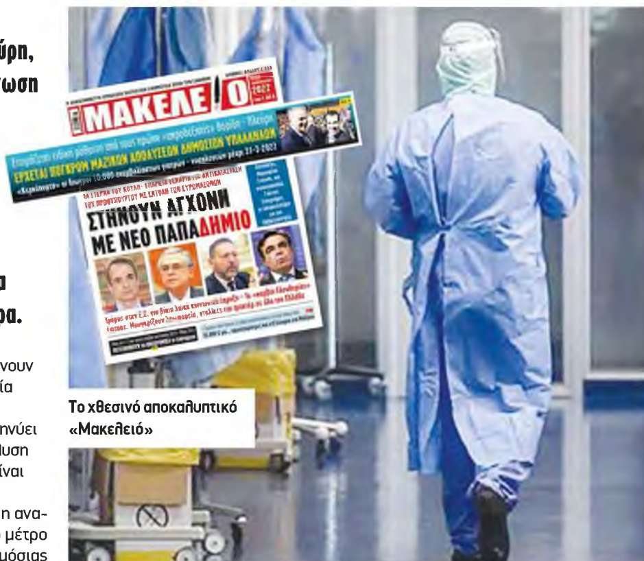
Το χθεσινό αποκαλυπτικό «Μακελειό»

«Το καλοκαίρι μας έλεγαν ότι η αναστολή εργασίας είναι ένα ειδικό μέτρο που αφορά την προστασία της δημόσιας υγείας και όχι πειθαρχική ποινή γι' αυτή και είναι συνταγματικό», τονίζει μεταξύ άλλων η ΠΟΕΔΗΝ. «Πού είναι όλοι αυτοί οι Συνταγματολόγοι να μας πουν τι λένε τώρα για τα περί απολύσεων Πλεύρη; Ποιο είναι το υγειονομικό όφελος αυτού του μέτρου να μας εξηγήσουν;», διερωτάται με καυστικό τρόπο η Ομοσπονδία.