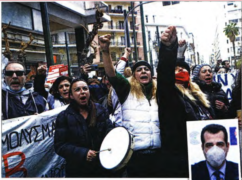
Από τη χθεσινή διαμαρτυρία της ΠΟΕΔΗΝ έξω από το υπ. Υγείας. Ενθετή: Ο Θ. Πλεύρης

Σύμφωνα με πληροφορίες, η απόλυση υγειονομικών θεωρείται από τους συνδικαλιστικούς φορείς της ομοσπονδίας αλλά και της ΟΕΝ-ΓΕ «κόκκινη γραμμή» και αν ο Θάνος Πλεύρης επιχειρήσει να φέρει το ζήτημα στη Βουλή, είναι δεδομένο πως θα υπάρξει ραγδαία κλιμάκωση των κινητοποιήσεων.