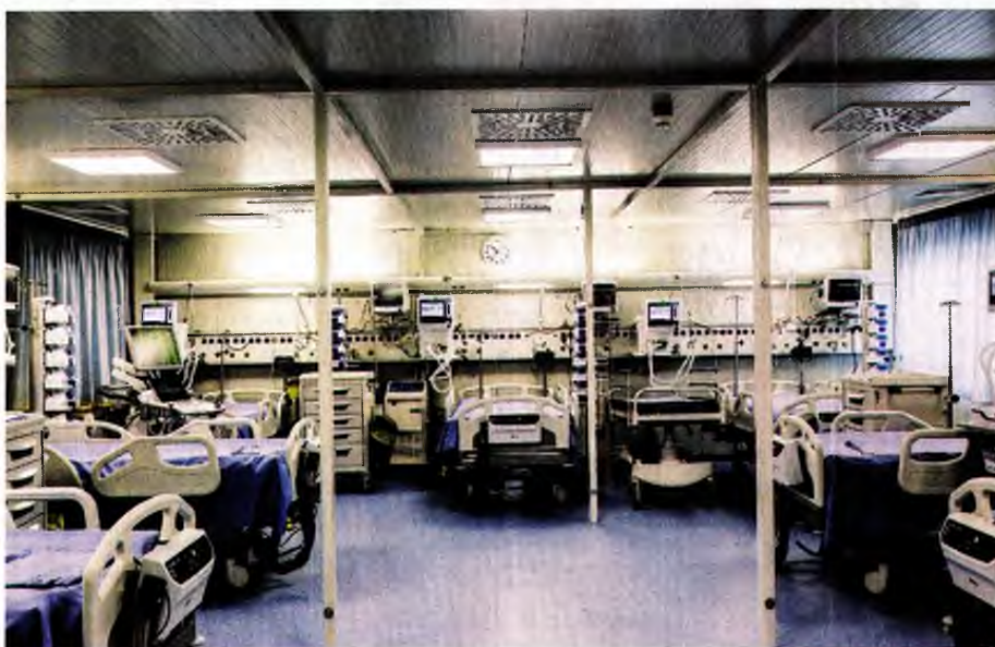
Σύμφωνα με τα στοιχεία που παρουσίασε χθες το υπουργείο Υγείας, σήμερα είναι διαθέσιμες για το δημόσιο σύστημα Υγείας 1.347 κλίνες ΜΕΘ. Από αυτές, 702 διατίθενται για ασθενείς με COVID-19.

Σύμφωνα με τα στοιχεία που παρουσίασε χθες το υπουργείο