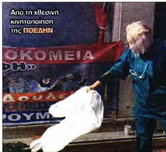
Από τη χθεσινή κινητοποίηση της ΠΟΕΔΗΝ

«Η κυβέρνηση προετοιμάζει την επιστροφή του εργασιακού Μεσαίωνα στα νοσοκομεία και οι εργαζόμενοι «ακονίζουν τα μαχαίρια τους» και ετοιμάζονται να αναλάβουν με