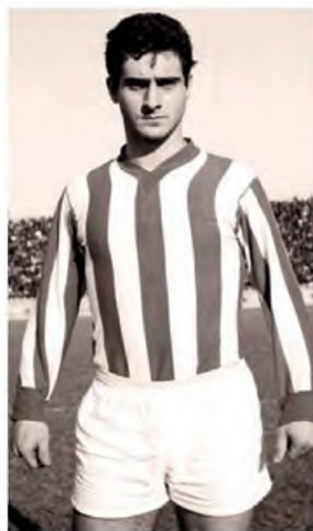
Στα γήπεδα όπου λατρεύτηκε από μικρούς και μεγάλους

Επίσης, ήταν διεθνής με την εθνική ομάδα, πραγματοποιώντας δώδεκα συμμετοχές. Επίσης, κατέκτησε το Παγκόσμιο Κύπελλο Ποδοσφαίρου Ενόβλου, δύο φορές, το 1968 και το 1969.