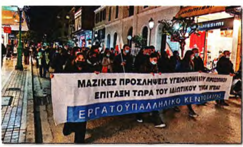
που πήραν μέρος στη μεγάλη συγκέντρωση με τα συνδικάτα της Αττικής, να συνεδριάσουν, να λάβουν αποφάσεις».

Στην πρώτη γραμμή του αγώνα για τη διεκδίκηση μέτρων προστασίας της υγείας, του εισοδήματος και της υπερασπίσης όλων των εργασιακών δικαιωμάτων των εργαζομένων, του λαού συνολικά, βρίσκονται τα Εργατικά Κέντρα Πάτρας, Αγρινίου, Αμαλιάδας, Ζακύνθου και Κεφαλονιάς - Ιθάκης. Με την κοινή πρωτοβουλία - κάλεσμα που πήραν, διεκδικούν μέτρα θωράκισης των νοσοκομείων, αλλά και ουσιαστικής ανακούφισης από την ακρίβεια που χτυπάει τα λαϊκά νοικοκυριά. Και με σειρά αγωνιστικών δράσεων τοπικά, συλλογή αίματος στις πόλεις των πέντε νομών το Σάββατο 26 Φεβράρη (11.30 π.μ.) και κλιμάκωση στην Πάτρα, καλών κάθε σωματείο και φορέα να συντονίσει τη δράση του, να μπει μαχητικά στην πάλη. Επιδιώκουν το μήνυμά τους να φτάσει σε κάθε χώρο δουλειάς, γειτονικές πόλεις, και χωριά, όπου ζει και εργάζεται καθημερινά ο λαός. Όπως λένε συνδικαλιστικά στελέχη των Εργατικών Κέντρων, πρόκειται για πρωτοβουλία - συνέχεια των πολυμορφων δράσεων που έχουν αναπτύξει και έρχεται να «ενώσει» δυνάμεις, να ακουστούν δυνατά τα αιτήματα των εργαζομένων, να ικανοποιηθούν άμεσα υπαρκτές ανάγκες. Ο «Ριζοσπάστης» προσμήλησε με τους πρόεδρος των Εργατικών Κέντρων για την πρωτοβουλία τους η πρωτοβουλία να ανακαλύψει πλατιά τους εργαζόμενους, κάθε λαϊκό άνθρωπο που βιώνει σήμερα σωρεία προβλημάτων.