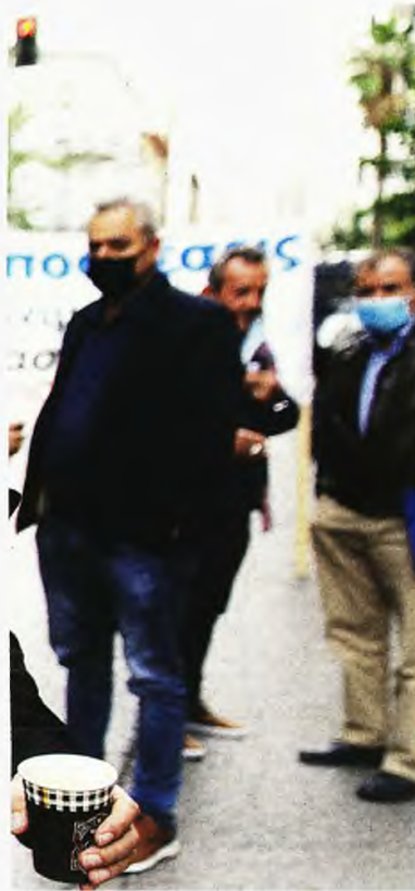
Αβέβαιο είναι το εργασιακό μέλλον των εργαζομένων στη φύλαξη, τη σίτιση και την καθαριότητα των νοσοκομείων

Σύμφωνα με όσα κατήγγειλε ο Παύλ. Πολάκης, το ίδιο πρόσωπο φέρεται να είναι ιδιοκτήτης της εταιρείας Kapa Data Consulting , η οποία ανέλαβε τη διαχείριση των προσωπικών δεδομένων των μελών της ΕΝΕ με απευθείας ανάθεση.