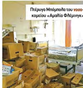
Πτέρυγα Μπόμπολα του νοσοκομείου «Αμαλία Φλέμινγκ»

Πόσους κλάψαμε επειδή... αφήνουν ανεκμετάλλευτα τα κλειστά νοσηλευτικά ιδρύματα;