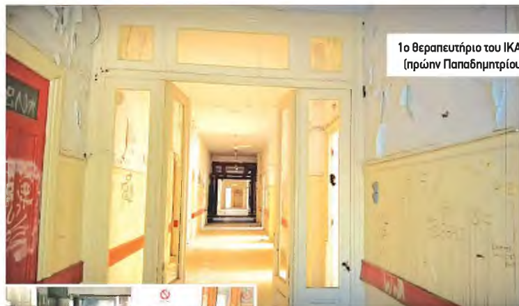
1ο θεραπευτήριο του ΙΚΑ (πρώην Παπαδημητρίου)

■ Το Νοσοκομείο Δυτικής Αττικής «Αγ. Βαρβάρα» (πρώην «Λοιμωδών») είναι ένα από τα νοσοκομεία που έχουν βάλει ρουκέτο και θα μπορούσαν να βοηθήσουν επίσης μέσα στην πανδημία. Σε αυτό λειτουργούσαν δύο Παθολογικές κλινικές, Καρδιολογική, Χειρουργική, Νευρολογική, χειρουργικών ειδικοτήτων (Οφθαλμολογική, Ουρολογική, ΩΡΛ), Μονάδα Τεχνητού Νεφρού, Ανασθησιολογικό τμήμα, Ακτινολογικό, πλήρης εργαστηριακός έλεγχος (Μικροβιολογικό, Αιματολογικό, Βιοχημικό), τακτικά εξωτερικά ιατρεία με όλες τις ειδικότητες των κλινικών κι επιπλέον Δερματολογικό, Ηπατολογικό, Ψυχιατρικό, Οδοντιατρικό, ενώ υπήρχαν 3 κρεβάτια εμφραγματίων. Από τις 214 κλίνες, λειτουργούσαν οι 135. Κάθε χρόνο στο νοσοκομείο γίνονταν περίπου 25.000 εισαγωγές, 100.000 επισκέψεις στα εξωτερικά ιατρεία, 1.500 χειρουργεία, εκατοντάδες χιλιάδες εξετάσεις στα εργαστήρια. Οι 700.000 κάτοικοι της Δυτικής Αθήνας όμως κατά τους κυβερνώντες (πρωινούς και προκατόχους) πίστευσαν ότι θα καλύπτονται από το «Αττικόν». Η διοίκηση αποφάσισε να «ανακαινίσει» μία πτέρυγα και να διαθέ-