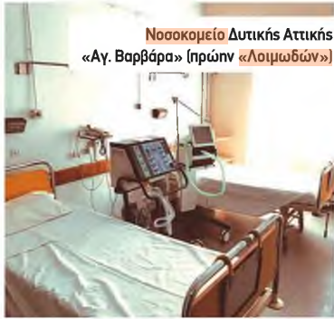
Νοσοκομείο Δυτικής Αττικής «Αγ. Βαρβάρα» (πρώην «Λοιμωδών»)