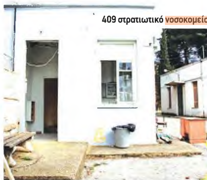
409 στρατιωτικό νοσοκομείο