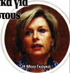
Η Μίνα Γκάγκα

Την πολιτική του... μαστίγιου και του καρότου φαίνεται πως ακολουθούν οι δύο υπουργοί Υγείας αναφορικά με το μέλλον των ανεμβολίασιων υγειονομικών που υπηρετούν στο Εθνικό Σύστημα Υγείας. Από τη μια, ο Θάνας Πλεύρης ξεκάρβωσε για ακόμα μια φορά, ακολουθώντας τη σκληρή γραμμή, πως η δική του εισήγηση είναι ο εμβολιασμός να αποτελεί τυπικό προσόν, ασκέτως της πανδημίας, επομένως όποιος υγειονομικός δεν εμβολιαστεί να μην μπορεί να παραμείνει στο ΕΣΥ. Από την άλλη, η αναπληρώτρια υπουργός Μίνα Γκάγκα φάνηκε πιο... μετρημένη, υποστηρίζοντας όμως πως ο εμβολιασμός πρέπει να γίνει τυπικό προσόν για την εργασία στο ΕΣΥ. «Αν αποφασίσουμε ότι ο εμβολιασμός είναι τυπικό προσόν για τους ανεμβολίαστους που είναι στο σύστημα υγείας, τότε πρέπει να το ξασκαφεύμε...» είπε χαρακτηριστικά η κυρία Γκάγκα.