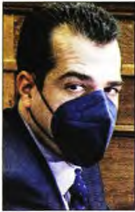
Ερχεται επιβάρυνση των ασθενών με τα κόστη των χειρουργείων

«Τις τελευταίες ημέρες έχουν ανακοινωθεί δύο σενάρια για την ανατροπή των εργασιακών σχέσεων των γιατρών στα δημόσια νοσοκομεία . Το σενάριο Γκάγκα προβλέπει κατάργηση της αποκλειστικής απασχόλησης για τους υπηρετούντες γιατρούς του ΕΣΥ με προνόμιο ταυτόχρονης άσκησης της ιατρικής σε ιδιωτικά και ιδιωτικές κλινικές, αντί να δοθεί επιπέδους αξιοπρεπής μισθός, κάτι που η Πολιτεία αρνείται να κάνει, παραβιάζοντας σχετική τελεσίδικη απόφαση του ΣτΕ που είχε εκδοθεί τον Φεβρουάριο του 2018. Το σενάριο Πλεύρη προβλέπει εισβολή ιδιωτών γιατρών στο ΕΣΥ με part time εργασία και απογευματινά χειρουργεία, για τα οποία οι ασθενείς θα πληρώνουν από την τσέπη τους, κάτι που είχε ξανασερβιριστεί επί κυβέρνησης Σαμαρά - Βενιζέλου με υπουργό τον Αδωνι Γεωργιάδη και το οποίο δεν είχε εφαρμοστεί λόγω αντιδράσεων. Και τα δύο σενάρια σημαίνουν κατάργηση του ΕΣΥ και του δικαιώματος των πολιτών για δημόσια και δωρεάν περίθαλψη».